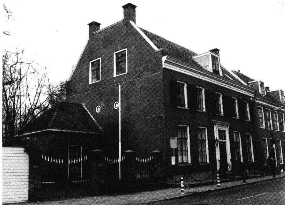
Afb. 2. Het huis Binnenrust te Abcoude in 1994 aan de Zuid- en Oostzijde.