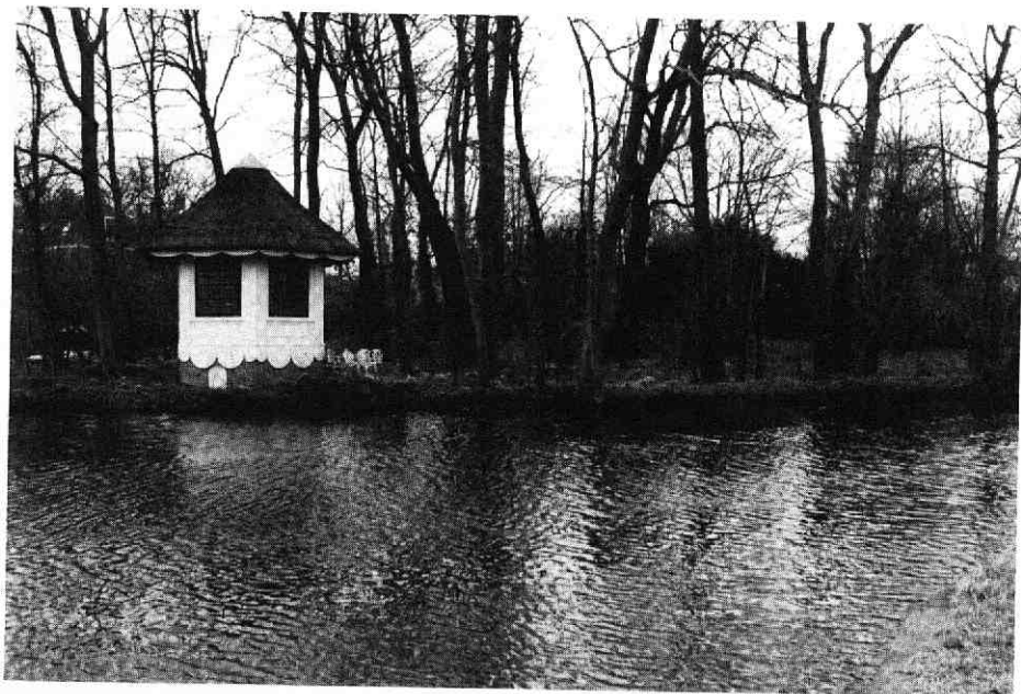
Afb. 4. De verplaatste koepel van Binnenrust aan de Angstel. In het park zijn de opgeworpen heuveltjes van de landschappelijke aanleg te zien.

laurierboom in tobbe, een baggerbeugel en een snij [kort zeisblad aan een lange steel om waterplanten los te snijden], een totebel [vierkant net dat met de hoekpunten aan twee kruislingse stokken is opgehangen], een gebbe [aan een vorkvormige stok bevestigd schepnet], een zaadwan en een zaadkast [men won kennelijk zelf zaad], broeiramen met glas en met papier voor op de koude bakken. 12 ramen vormden een druivenkast. In de koepel hingen vijf gestreepte linnen rolgordijnen en daarbuiten zes stores [zonnewerende jalouzieluiken]. In 1878 halveerde Holst het park door ca \frac{3}{4} ha te verkopen als bouwgrond waarop in het jaar daarna een woonwijk werd opgetrokken. De huizen daarvan liggen aan wat nu De Laan van Binnenrust heet, doch die eerst gewoon de Nieuwe weg heette. Dat betekende een grote aanslag op het buitenplaatskarakter van Binnenrust. Was het omdat Holst 7 kinderen moest opvoeden? Hij had daarvoor een gouvernante in dienst en 3 dienstbodes. 4 Mogelijk had hij als commissienair een slecht jaar gehad, het blijft gissen. Wel is opmerkelijk dat het gezin in 1886 naar Nieuw Amsterdam vertrok waar hij waarschijnlijk in de verveningen fortuin is gaan zoeken. Ruim zeven maanden eerder had de heer Van Veen het huis gekocht, kennelijk als belegging, want hij verhuurde het aan een familie