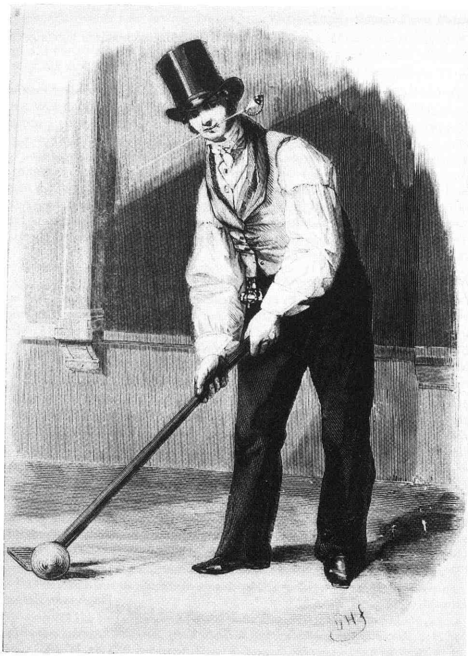
De Kolver, door Henry Brown 1841.