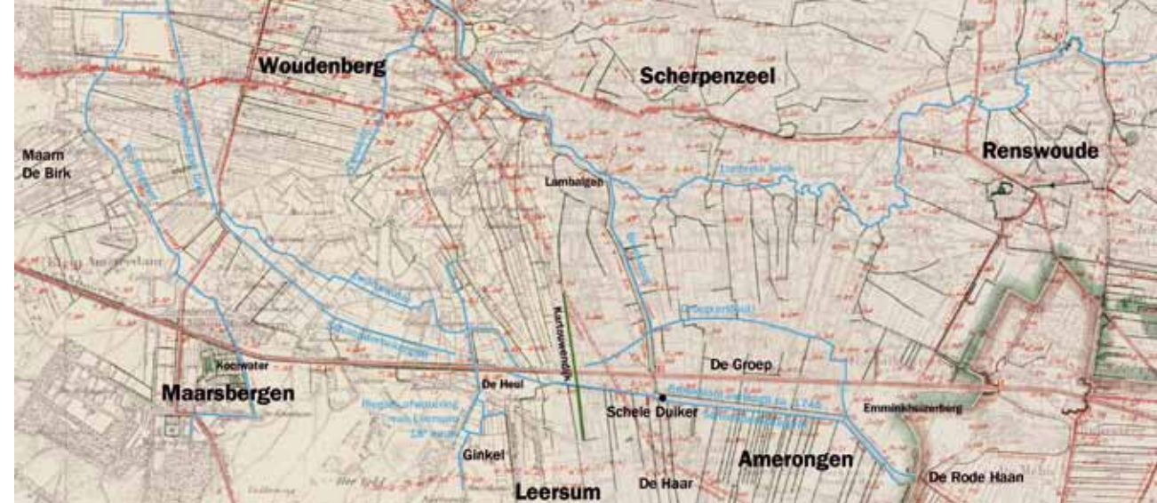
Kaart met situatie van de Heigraaf, Zwartewater, Schoonderbekergrift, Groep, Broeksloot en Rode Haan.

denbergse Grift. De hogere gronden van Amerongen, Leersum en Maarsbergen konden daarna afwateren op de nieuwe Grift, waardoor de betekenis van de Broeksloot als waterlozing voor hen verminderde. Het Zwartewater bleef echter wel van belang voor de afwatering van de Maarsbergse Meent.