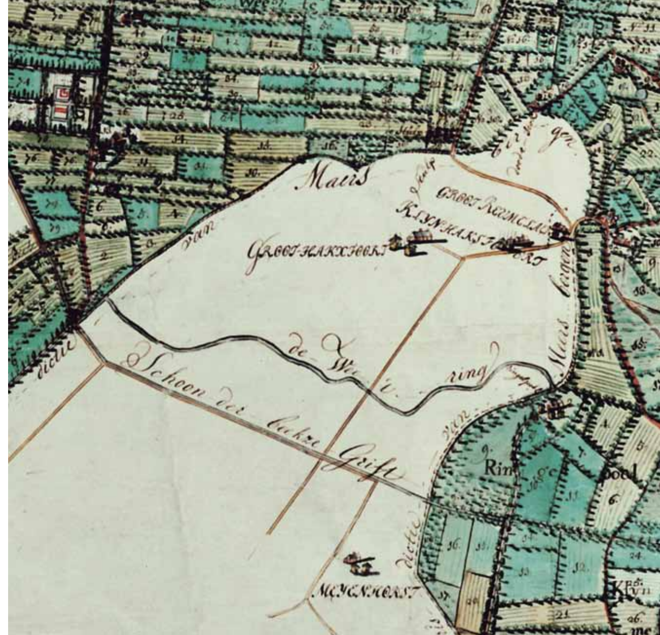
Kaart van Woudenberg (detail) van Justus van Broeckhuijsen, 1717. Het Zwartewater wordt hier De Weetering genoemd. (origineel in Schoutenhuis, Woudenberg)

oosten van Groot Ringelpoel is dat op Woudenbergs gebied niet meer mogelijk. Bij de aanleg van de Schoonderbekergrift in 1550 zijn misschien ook delen van de Groep in de Grift zelf opgenomen of daarna verdwenen.