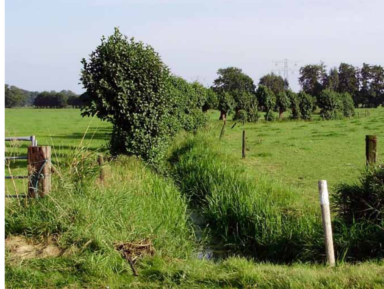
Het Zwartewater bij de kruising met de Rottegatsteeg in Maarsbergen, 2011.

Het ligt voor de hand dat de proost van Maarsbergen in 1370 een watergang heeft laten aanleggen om het water van zijn landen af te voeren naar de nieuwe heul die hij van de heer van Woudenberg mocht leggen in de Monnikendijk naar de Zeesloot. Deze watergang wordt niet in de oorkonde vermeld, omdat de aanleg een zuiver Maarsbergse aangelegenheid betrof, waar de heer van Woudenberg, die de oorkonde uitgaf, geen bemoeienis mee had. Er zijn geen bronnen waaruit de aanleg van de watergang blijkt, maar uit onderzoek ter plaatse en bestudering van oude kaarten kan worden afgeleid dat hij langs de Rottegatsteeg moet hebben gelopen. De kaarten van Maarsbergen en Woudenberg van 1716 en 1717 tonen dat deze weg begint op de overgang van Heuvelrug naar de Vallei. Verder loopt het tracé midden door het lage deel van Maarsbergen naar het noorden tot aan de boerderij Lammersdam op de grens met Rumelaar. De afvoerwatergang kan in 1370 alleen ten noorden van het Zwartewater hebben gelopen, want hij mocht geen verbinding met dat water hebben. Gezien de helling in het terrein zou er anders water vanuit het Zwartewater door de