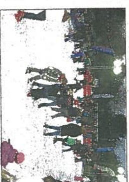
Maarssen on Ice in 2011, aan de Huis ten Boschstraat.

Ismester Arjen van den Hoek is blij met de nieuwe locatie. Deze is veiliger voor kinderen, gezelliger door de ligging in het park en meer beschut door de bomen. Vorig jaar lag de ijsbaan aan de