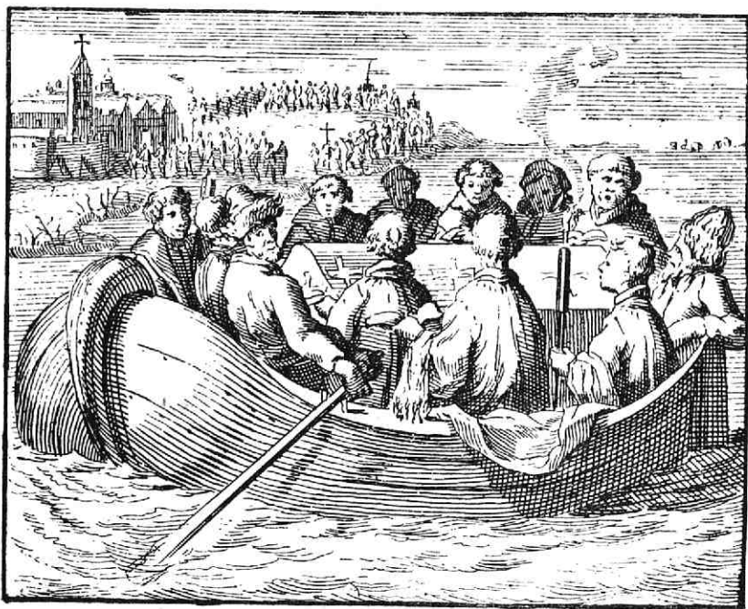
De Kanunniken van Utrecht halen het lijk van Bonifacius.