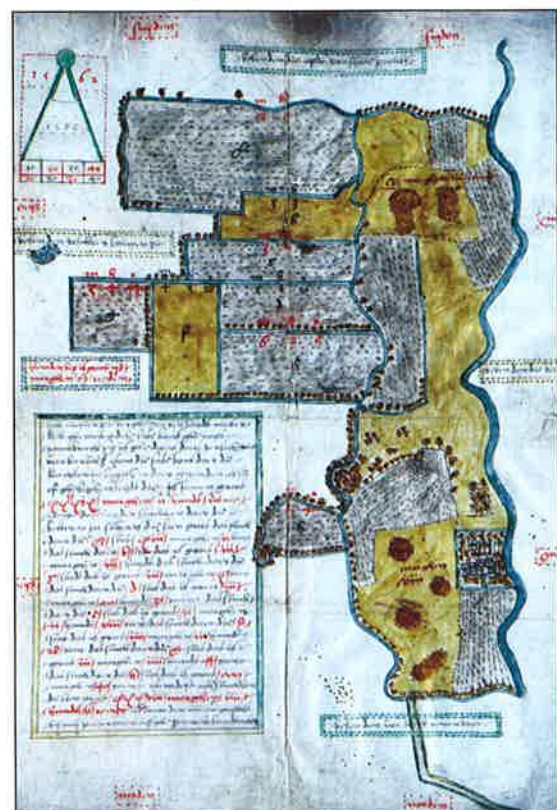
Links: Kaart van Randenbroek, 1562. Onder: Villa Ma Retraite, voorheen Boezenberg, circa 1910.

Zowel de geschiedenis van de buitenplaatsen als die van de bewoners vinden we terug in zogenaamde huisarchieven. In het depot van Archief Eemland worden de huisarchieven bewaard van de buitenplaatsen Randenbroek, Birkhoven en Schothorst. Maar ook het in het vorige artikel beschreven Berg en Dal (zie pp. 23-23).