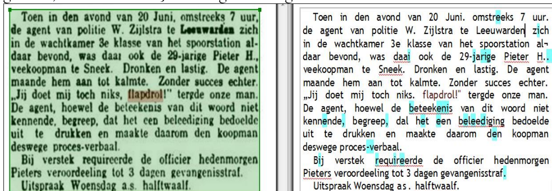
Fragment uit de Leeuwarder Courant van 1913.

Vervolgens krijg je dit te zien: links de afbeelding, rechts de uitgetikte (door ocr-software gelezen) tekst. Die kun je vervolgens corrigeren.