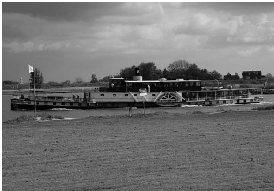
De Kapitein Kok in de buurt van Schoonhoven. Blijkbaar is iedereen net genodigd aan het buffet want er is niemand aan dek.