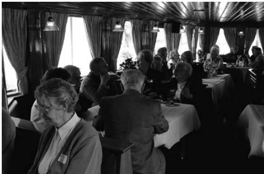
Een hoekje van de radersalon