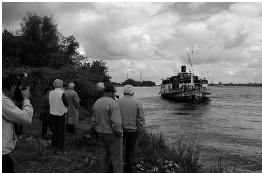
Vertrek vanaf de IHC Scheepswerf in Krimpen aan de Lek