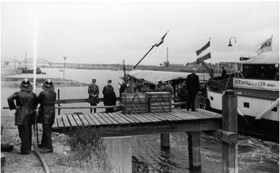
De inwoners van Krimpen aan de Lek en andere gemeenten werden begroet met een ereboog van water (wie kent het idee daarachter?). Op de achtergrond de oude spoorbrug.