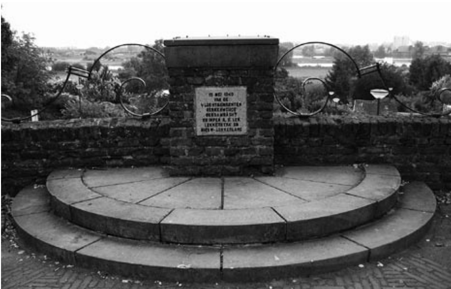
De oriënteertafel tegenover het oude gemeentehuis aan de Herenstraat bovenaan de Buitennomme.

De bedoeling van ons verblijf in 'De Walvis' was om evacuees en opvanggezinnen met elkaar in contact te brengen. De opkomst van voormalige opvanggezinsleden viel wat tegen, hoewel in de lokale pers voldoende aandacht was geschonken aan