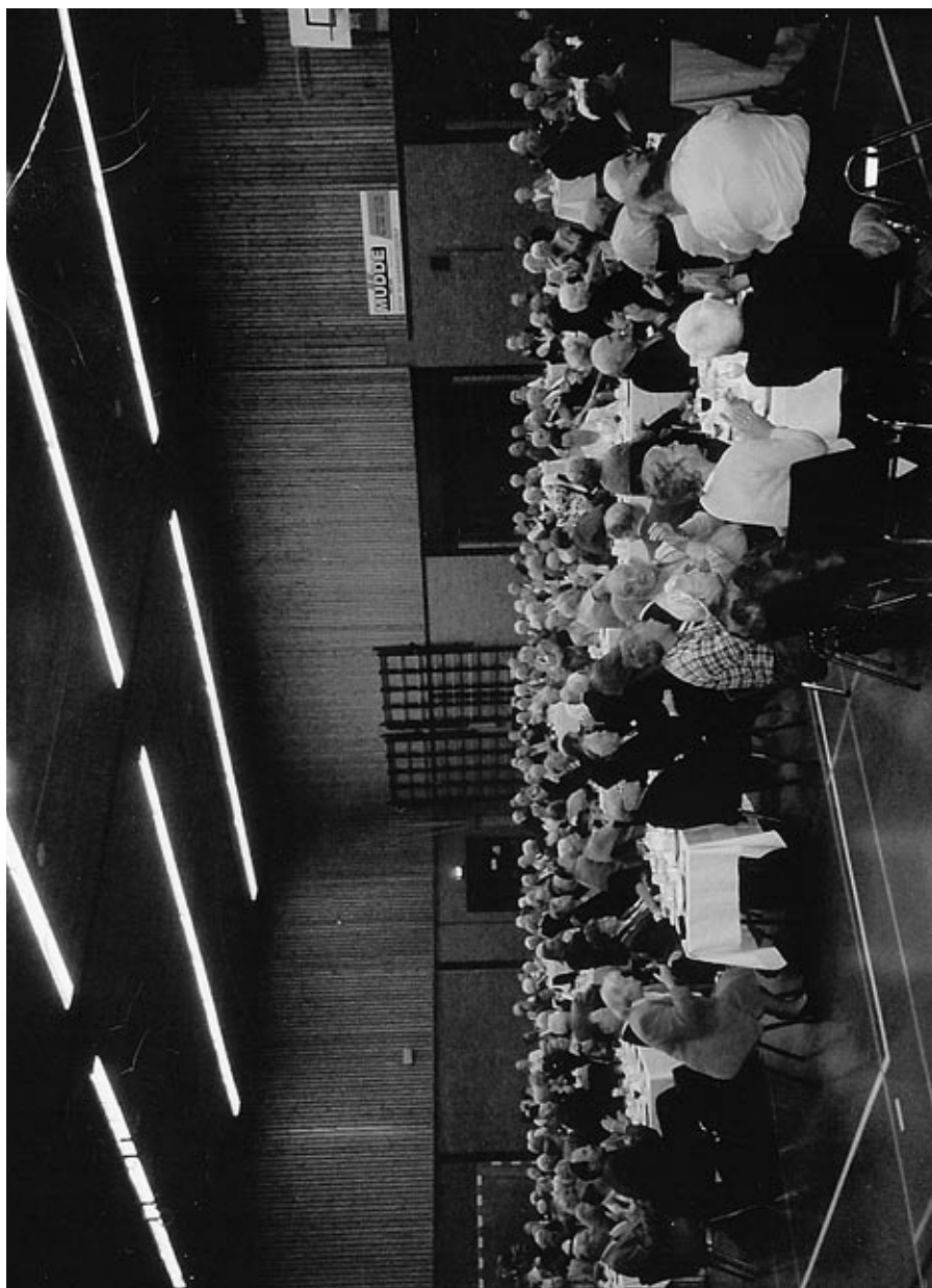
Sporthal De Walvis met oude bekenden uit Rhenen en de Krimpenervaard