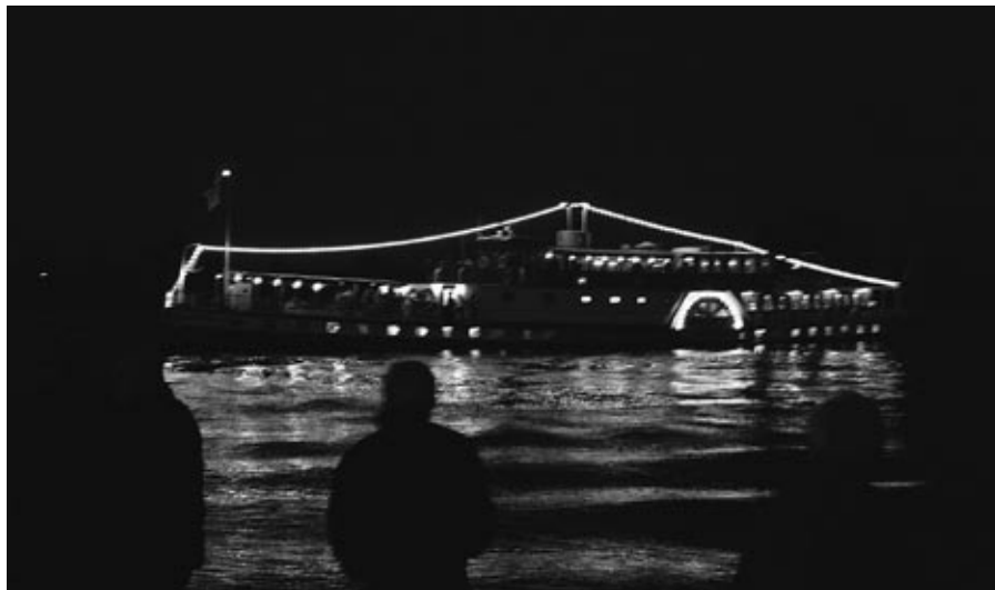
Aankomst bij de Loswal in Rhenen

hadden om naar Rhenen te rijden waar de Kapitein Kok tussen kwart over tien en half elf aan de Loswal aanlegde. Het was toen aan het donkeren zodat kapitein Van Hulten de bootverlichting aan deed waardoor vanaf de wal mooie foto's gemaakt konden worden.