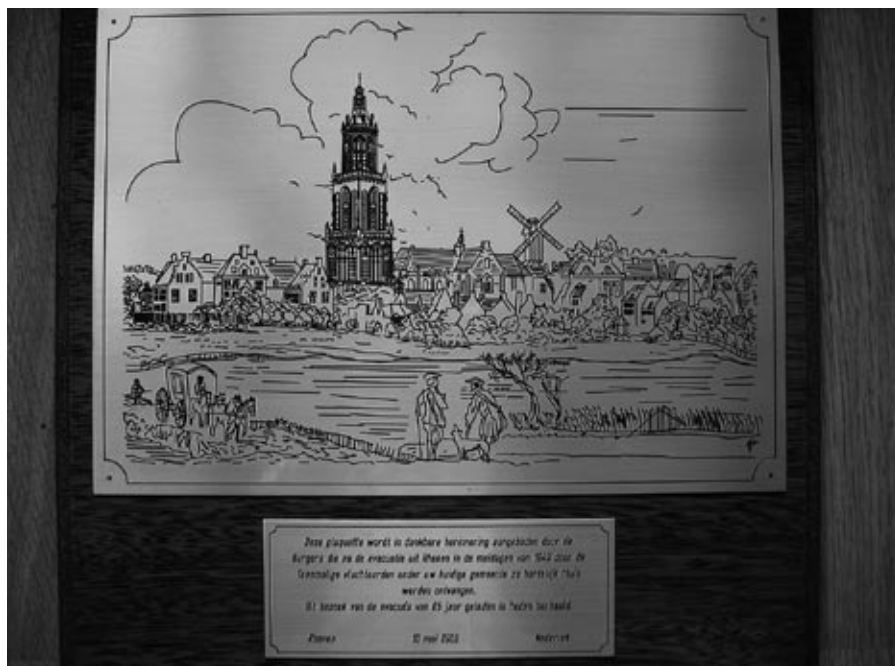
De plaquette met de uitsnede uit de gravure van 1772 naar Jan de Beijers tekening uit 1745, voorstellende 'De Stad Rhenen en het Rhenense gebergte tot op Wageningen, vanaf de overzijde des Rijns te zien'.

de ontvangst. Blijkbaar leven de gebeurtenissen uit de meidagen van 1940 bij de Krimpense kinderen van toen niet in die mate als in Rhenen. Misschien ook wel begrijpelijk want de ervaringen zijn niet met elkaar te vergelijken. Wat voor de een een vlucht was met achterlating van al wat dierbaar was, betekende voor de ander niet meer dan een paar weken een aantal onverwachte logees in huis.