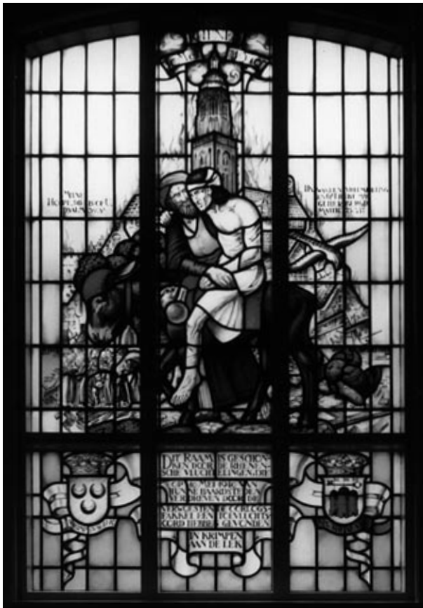
Het gedenkraam in de N.H. Kerk in Krimpen aan de Lek

Op het raam staat de tekst: Dit raam is geschonken door de Rhenense vluchtelingen, die op 10 Mei 1940 van hunne haardsteden verdreven door de verwoestende oorlogsfakkkel een toevluchtsoord hebben gevonden in Krimpen aan de Lek.