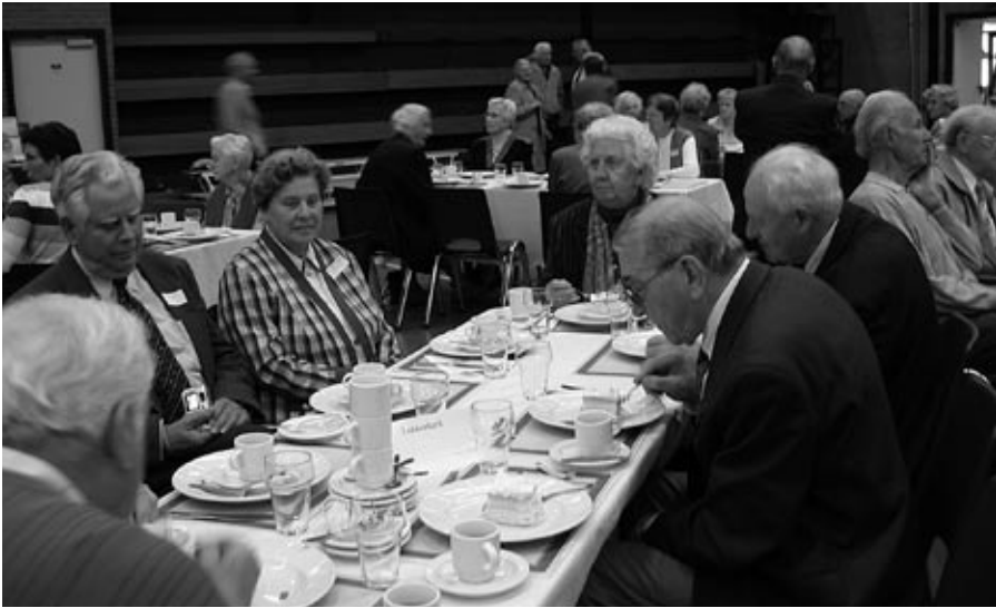
Lunch in de sporthal De Walvis, Krimpen aan de Lek