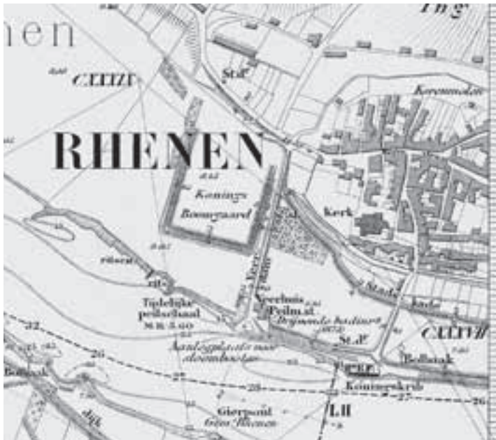
Een detail van een oude rivierkaart waarop de badinrichting in de Rijn is vermeld. Deze lag vlak bij de veerstoep, gemakkelijk bereikbaar voor plaatselijke zwemlustigen.