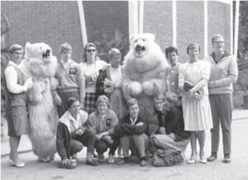
De Nederlandse zwemploeg met geheel rechts de bekende Ada Kok