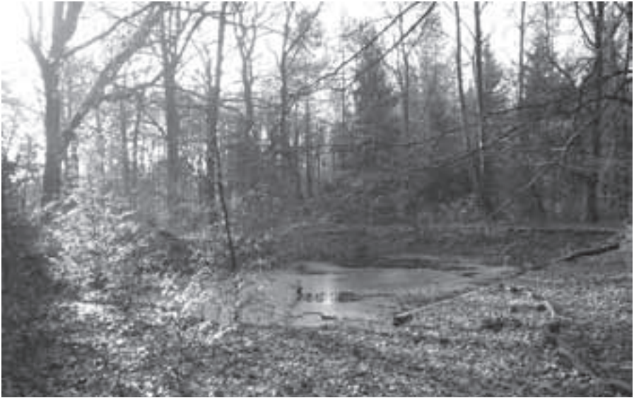
Een blik op het vervallen zwembad in het bos schuin achter Remmerstein