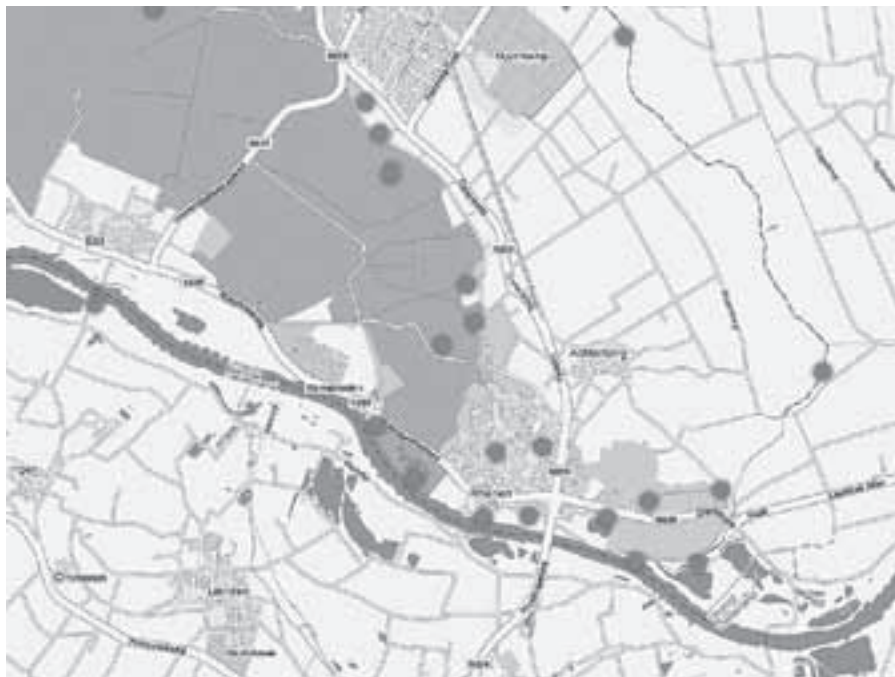
Bijlage: Op dit kaartje zijn alle beschreven zwemplekken en zwembaden aangegeven..