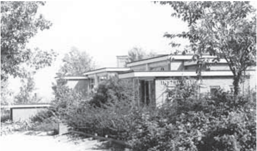
De toegang van het Lijsterbergbad onder de kleuterschool