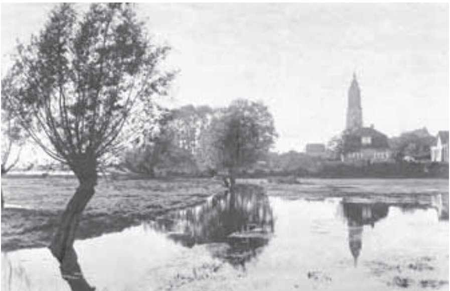
In het Kleigat, een laagte in de uiterwaard ontstaan door afgraving van klei voor de steenoven, werd ook wel gezwommen

Natuurlijk kan overal in de Rijn worden gezwommen. Je kunt als geoefende zwemmer immers vanaf elke krib in het water duiken. Toch trok men het meeste naar plaatsen waar gemakkelijk bereikbare strandjes aanwezig waren. In de uiterwaard voor de stad heeft een steenoven gestaan, die van 1829 tot circa 1910 in bedrijf is geweest. De bakstenen werden meestal door Rijnschepen vervoerd, waarvoor een aanlegplaats aanwezig was. Dit was ook de plek waar veel werd gezwommen. Maar ook daar zijn inwoners van Rhenen verdrongen, zoals in 1893 sigarenmaker Van den Berg en in 1955 Gijsbertus van Neerbos, die op de Kruidenfabriek werkte. Het was veiliger om in het nabijgelegen Kleigat te zwemmen, dat ontstaan was door afgraving van de klei uit de uiterwaard voor de baksteenproductie. De laagte liep bij hoog water onder. Dan kon er 's winters worden geschaatst en 's zomers gezwommen, het meeste door jongens die dat zonder toestemming van hun ouders en daarom ook meestal zonder zwembroek deden.