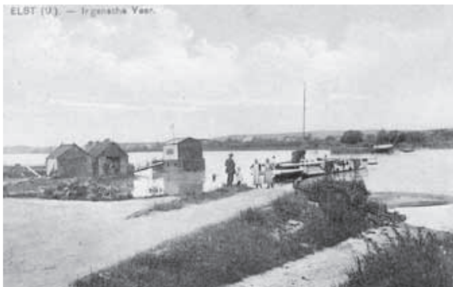
Het Rijnbad aan de Ingense kant van het veer waarvan inwoners van Elst via de pont gebruik konden maken