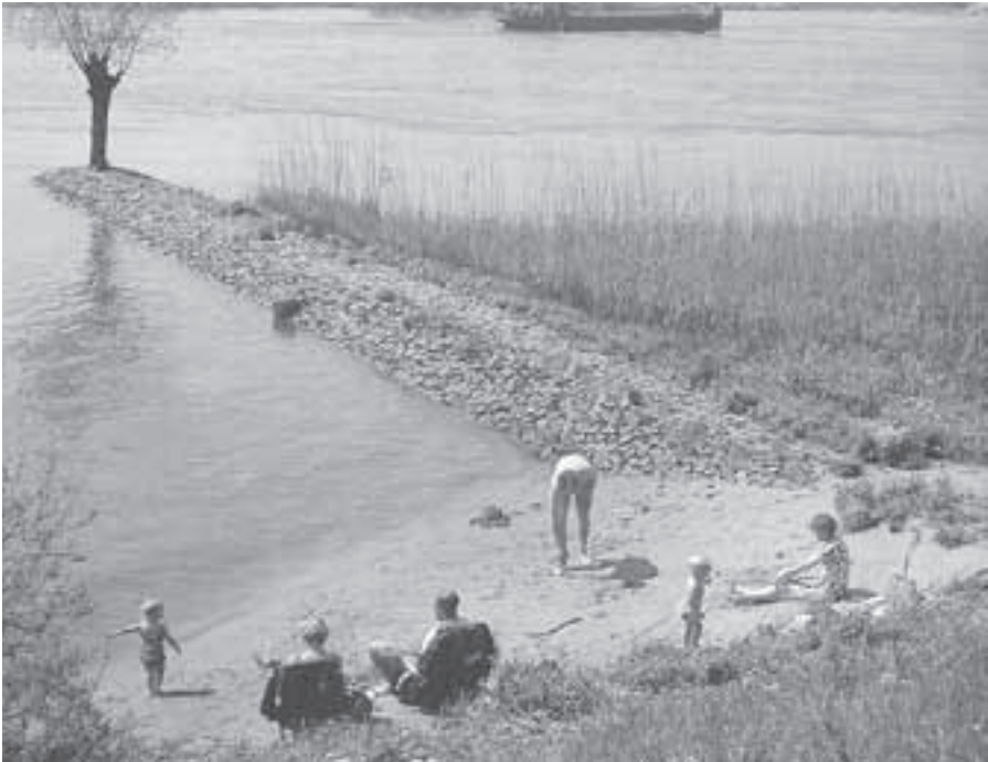
Recreatie aan de oevers van de Rijn. In de toekomst met badinrichting?

voor het kleine bad zelfs 32 graden. Er is sprake van dat deze club, met momenteel honderd leden, de statuten gaat veranderen om er een Rhenense vereniging van te maken. De exploitatie van Het Gastland is geprivatiseerd en in handen van de organisatie Sport & Leisure, die het geheel met subsidie van de gemeente runt. Aan de goede accommodatie die Het Gastland biedt ontbreekt een zonneweide; velen willen bij mooi weer toch ook buiten kunnen verblijven. In Rhenen is nog geen echt goede gelegenheid om te zwemmen en te zonnebaden. Wel werd er clandestien van op het oog mooi zwemwater gebruik gemaakt en is er een plan voor een recreatieplas ontwikkeld, zoals u hierna kunt lezen.