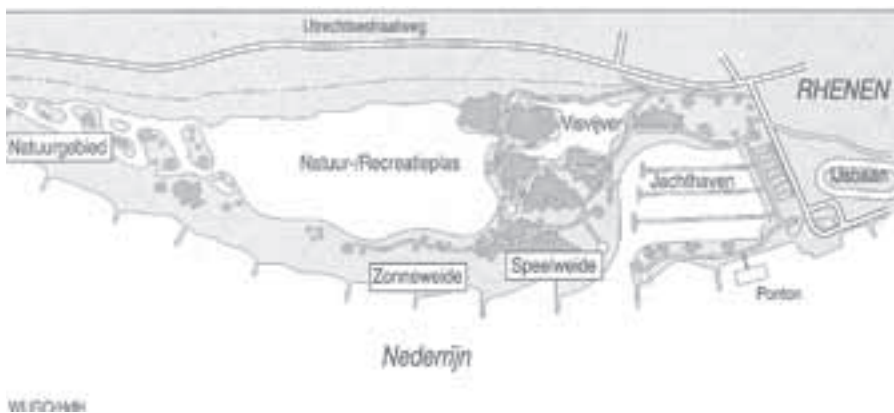
Een schets van het plan Palmerswaard met jachthaven, visvijver en recreatieplas