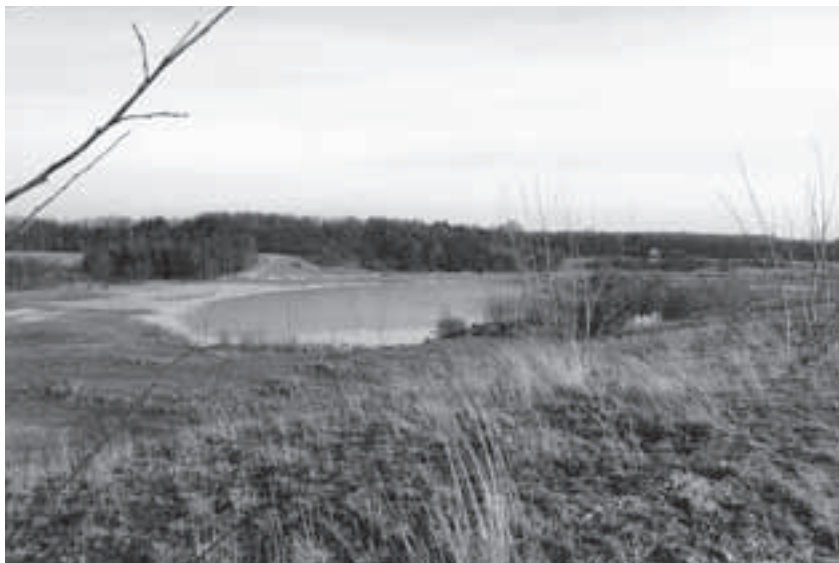
Het meertje van Kwintelooijen, gefotografeerd in 1990