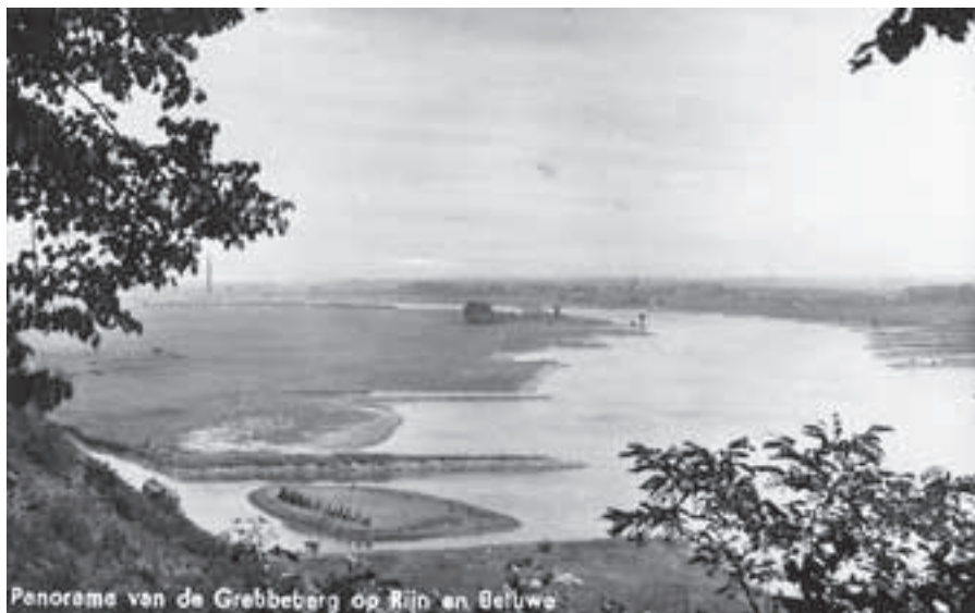
De plaats waar de Grift in de Rijn uitmondt werd vroeger het Grebsche Gat genoemd. Het eilandje is inmiddels verdwenen

zand vanuit de heuvelrug wordt veroorzaakt. Het Stek zal binnenkort via het doorgetrokken fietspad langs de Grift zijn te bereiken, maar is als zwemplek niet meer te herkennen.