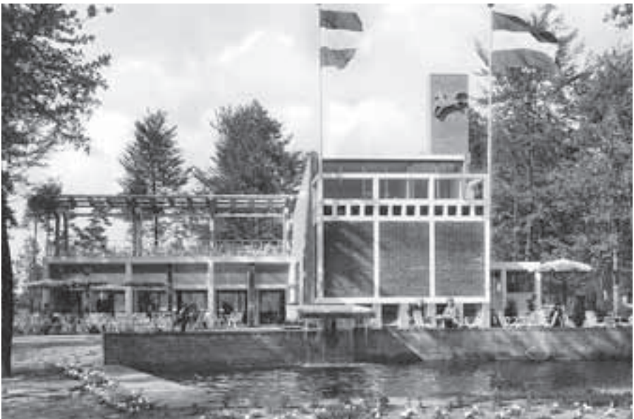
Restaurant De Koningstafel was van opvallende architectuur, maar werd desondanks in de jaren tachtig gesloopt