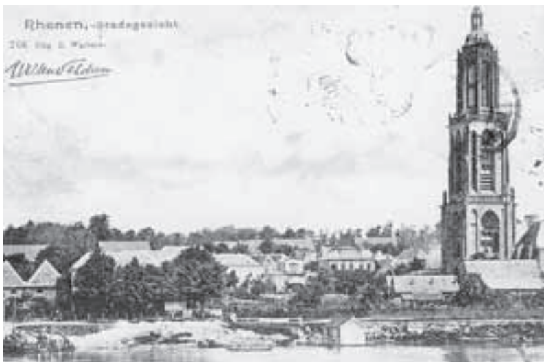
De badinrichting is met enige moeite op deze enig bekende afbeelding te zien; het is het houten huisje met puntdak waarop vlaggetjes en met hekken rond het loopgedeelte.