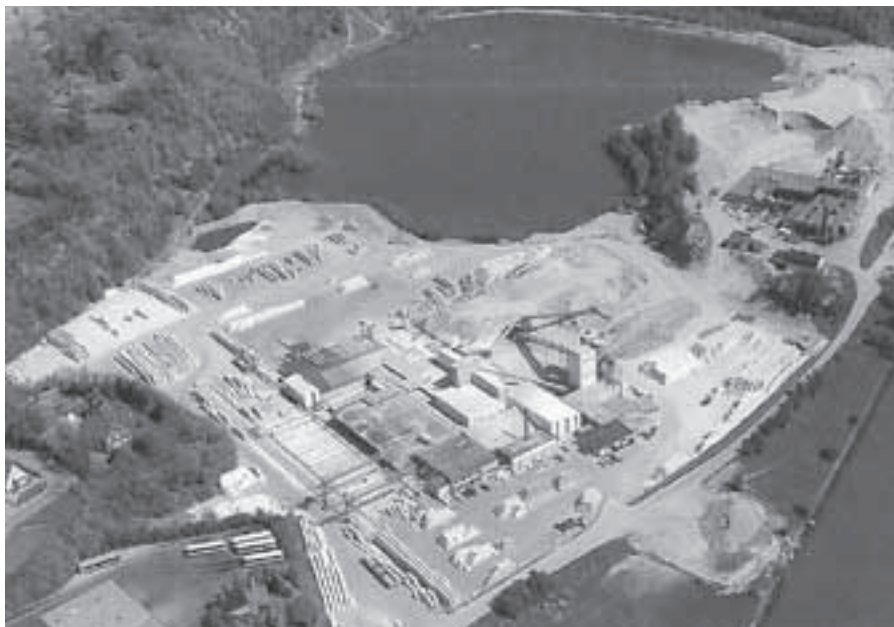
De plas in de zandafgraving van de Vogelenzang waar het heerlijk vertoeven was