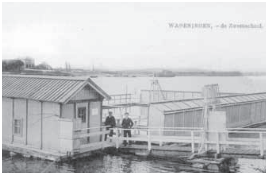
Het Rijnbad bij het Lexkesveer in Wageningen. De zwemruimte was afgeschermd van de rivier en daardoor was het zwemmen er minder risicovol. Dames konden er 's morgens en heren 's middags terecht, de laatstgenoemden ook op zondagen