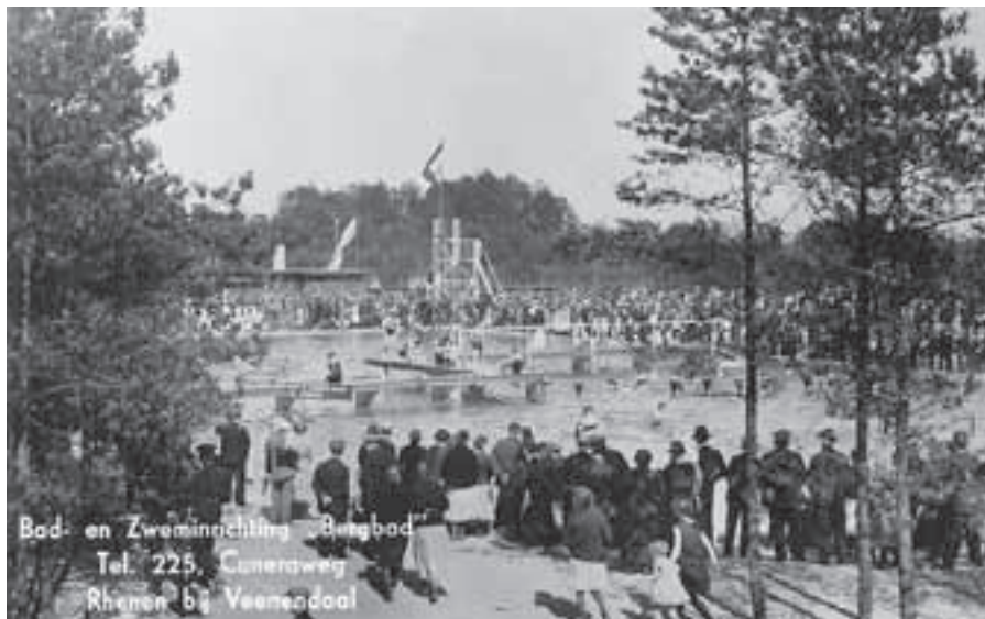
Opening van het Bergbad in 1933, waarvoor veel publiek was toegestroomd

1994 werd het oude bad gesloopt en vervangen door een kleiner modern zwembad voor de campinggasten. Ook inwoners van Rhenen hebben van het Bergbad gebruik gemaakt, maar zij zagen graag een dergelijk bad dicht bij de stad gerealiseerd. Voorlopig moest men het stellen met zwemmen in open water, met uitzondering van groepen die gebruik konden maken van de volgende grotere particuliere zwembaden.