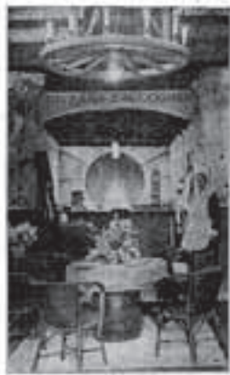
Een uitzicht uitover de Panorama-Molen.