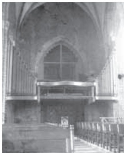
Werkzaamheden aan het orgel in oorlogstijd