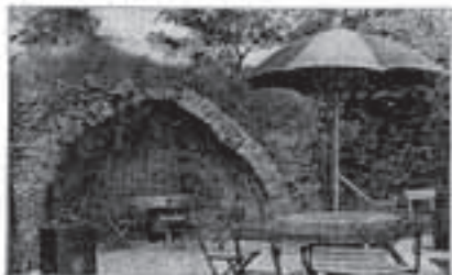
Het Rechten anno 1348. Hier vroegen de Rechtenen beltoeren, want die het geveligt sticht op het terrein der Panorama-Molen.