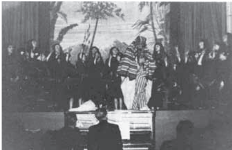
Opvoering van Zafnath-Paäñeah in gebouw Irene op 17 maart 1943