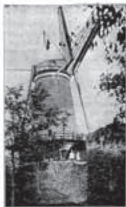
Panorama-Molen op zuidoostelijke helling.