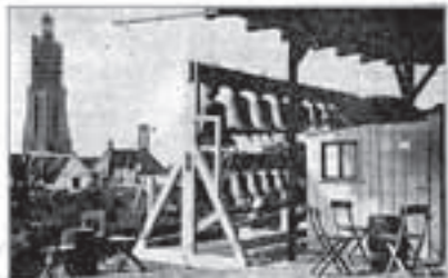
Het groote Carillon, beltoon over den Rechtenen, want geschiedkundig op het terrein der Panorama-Molen, 1800 jaar hooft de hooft de hooft de hooft.

Affiche van de uitvoeringen op 20 en 27 juli 1933