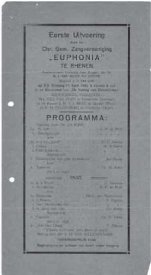
Affiche van de eerste uitvoering op 11 april 1933 (Coll. mevr. G.D. Beernart-van Eck)

jarig bestaan van Euphonia. Het jaar van oprichting is daarom waarschijnlijk 1932 of begin 1933 en niet 1931.