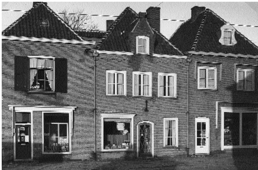
Enkele gevels in de Herenstraat

De slagvelden te Rotterdam, Middelburg, Rhenen en Wageningen openden voor de architectuur –zij het wrange- mogelijkheden. Behalve dat de oorlog vele slachtoffers had geëist, werden in de periode 1940-1945 in Nederland 80.000 woningen totaal verwoest, 40.000 zwaar en 400.000 licht beschadigd. Weldra werden de eerste plannen gesmeed om tot een integrale wederopbouw te komen. De voornaamste taak van het Ministerie van Wederopbouw en Volkshuisvesting hierbij was, zoals de toenmalige premier Schermerhorn in juni 1945 formuleerde: “mede te helpen aan het opbouwen van organisaties, die bij machte zijn, het wederopbouwwerk in het gewenste tempo in te voeren”.