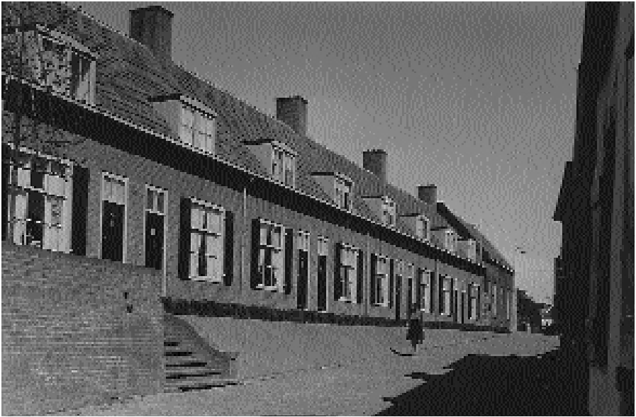
De Weverstraat na de herbouw

Tot de oorlog had Granpré Molière vooral aan de Technische Hogeschool in Delft zijn architectuuropvattingen vormgegeven. De Tweede Wereldoorlog met zijn even dramatische als voor de architectuur veelbelovende afloop bracht voor het eerst de confrontatie van ideeën met de andere architecten, de modernisten.