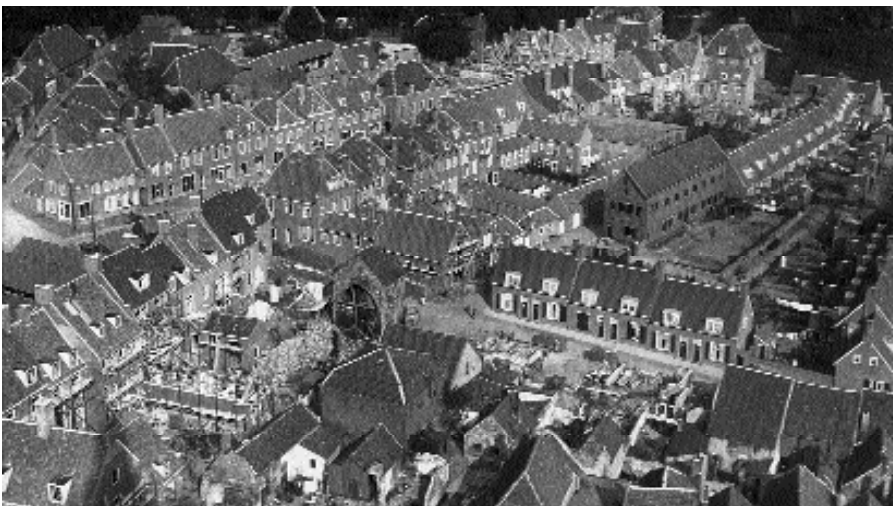
Nieuwbouw om de later afgebroken Gasthuiskapel

De leidsman van de traditionalisten was professor ir. M.J. Granpré Molière (1883-1972), hoogleraar bouwkunde te Delft. Na mei 1940 probeerde Granpré Molière aanvankelijk zijn colleges te continueren. Maar toen het zelfs niet meer mogelijk bleek colleges aan huis te verzorgen, zag hij zich genoodzaakt zijn onderwijs via brieven aan studenten voort te zetten. Vast staat dat Granpré Molière tijdens de bezetting onderdook, terwijl juist gedurende de oorlogsjaren bleek dat zijn traditionalistische architectuuropvattingen bijzonder goed pasten in de culturele theorie van de Duitse bezetter.