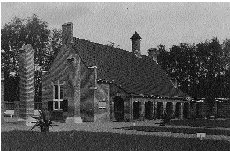
Het Administratiegebouw van Ouwehands Dierenpark in Delftse School-stijl

bestond er een sfeer van verdraagzaamheid. De oppositie trad pas aan het licht na 5 mei 1945 en is vanaf dat moment goed te volgen aan de hand van de pennensrijd die zich in de verschillende bouwbladen ontwikkelde.