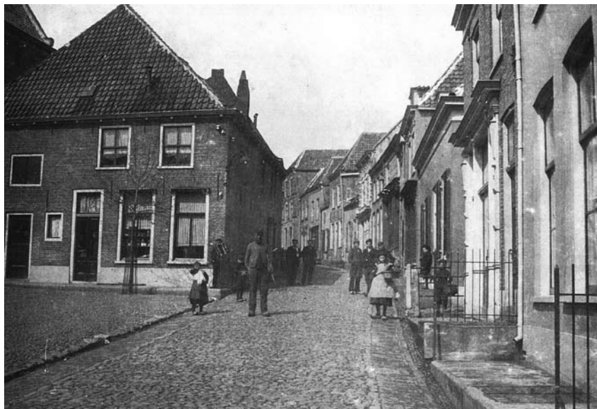
De Rijnstraat rond 1910