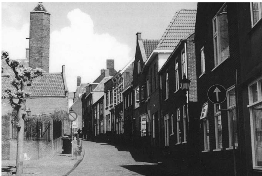
De Rijnstraat anno 2002