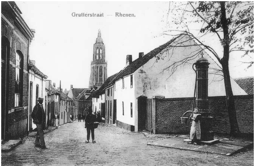
De Grutterstraat rond 1910