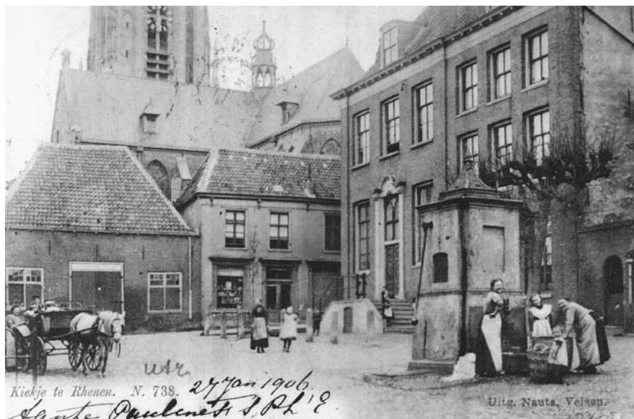
Het Marktplein met het raadhuis rond 1910