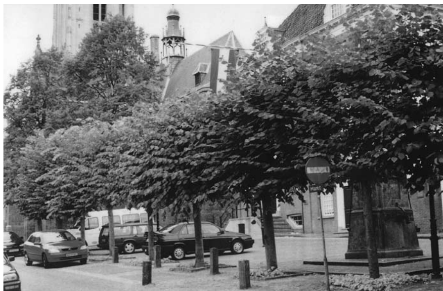
Het Marktplein met het raadhuis anno 2002