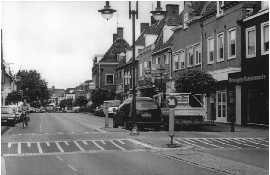
De Herenstraat anno 2002