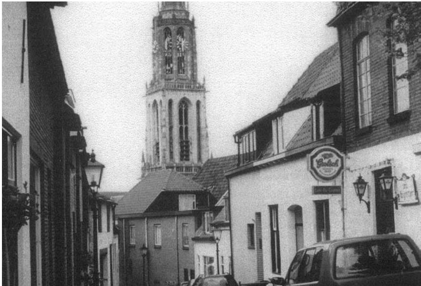
De Grutterstraat anno 2002