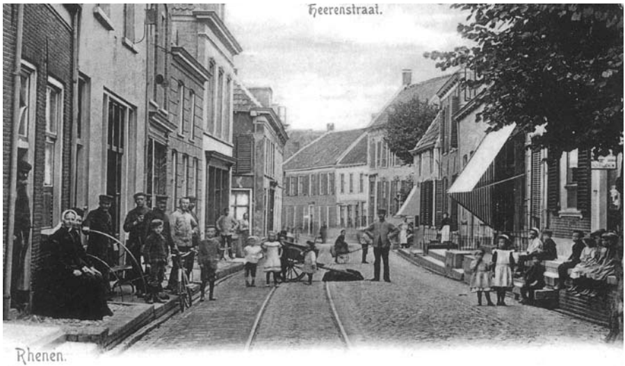
afgave P. Stolp, Rhenen.