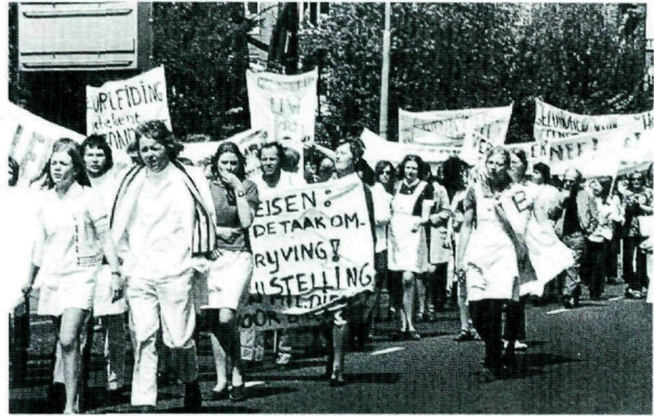
Protesterende verpleegkundigen tijdens de Witte Woede (1990).

massaal de straat op en een periode die als de 'Witte Woede' de geschiedenis in zou gaan, brak aan. Massale media aandacht was het gevolg. Politici werden wakker. De problemen van de verpleegkundige beroepsgroep kwamen weer op de politieke agenda te staan. Met overheidssubsidie werd in 1993 het Landelijk Centrum Verpleging & Verzorging opgericht, dat zich richtte op positieverbetering van verpleegkundigen en eenwording binnen het beroep. 21 Na veel vijven en zessen leidde dit in 1996 tot de oprichting van de Algemene Vergadering Verpleegkundigen en Verzorgenden, beter bekend als de AVVV. 22 Net als in 1945 kwam deze koepelorganisatie tot stand op instigatie van de politiek en door druk van buitenaf. Echter, weliswaar spelen obstakels als afhankelijkheid van medici en verzuiling inmiddels geen rol meer, de scherpe reductie van de overheidssubsidie vormt nog steeds een ernstige bedreiging voor het voortbestaan van de AVVV.