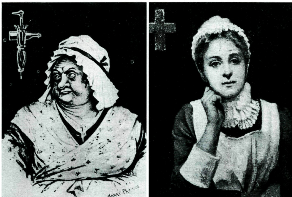
Afbeelding uit de Nursing record van 1888 die de radicale imago-verbetering van het verpleegkundig beroep in de periode 1838-1888 moest illustreren.

zeer te doen was om de zielszorg, traden vrouwen toch in deze religieuze organisaties in om als verpleegster te kunnen werken. 9