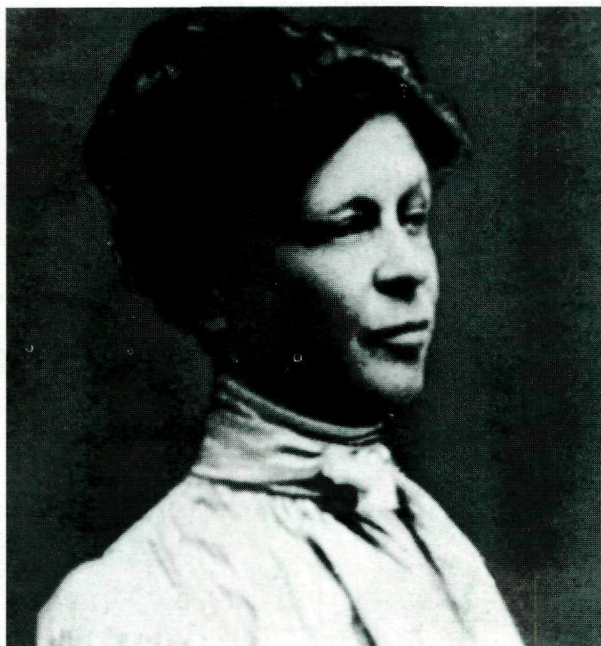
Lavinia Lloyd Dock (1858-1956), hoofdauteur van A history of nursing .