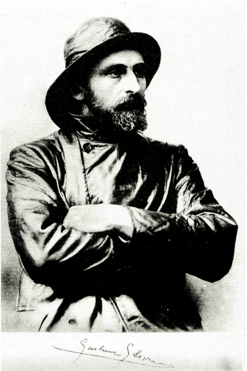
Afb. 2 Gustave Gilson.