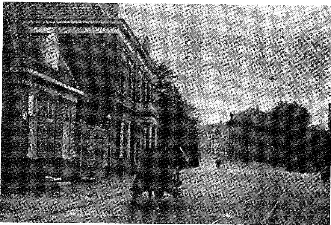
Afb.3. Heerenstraat 98a werd in 1924 bij de verbouwing van de kostschool (vanaf 1903 MULO-school) tot gemeentehuis drastisch gemoderniseerd.