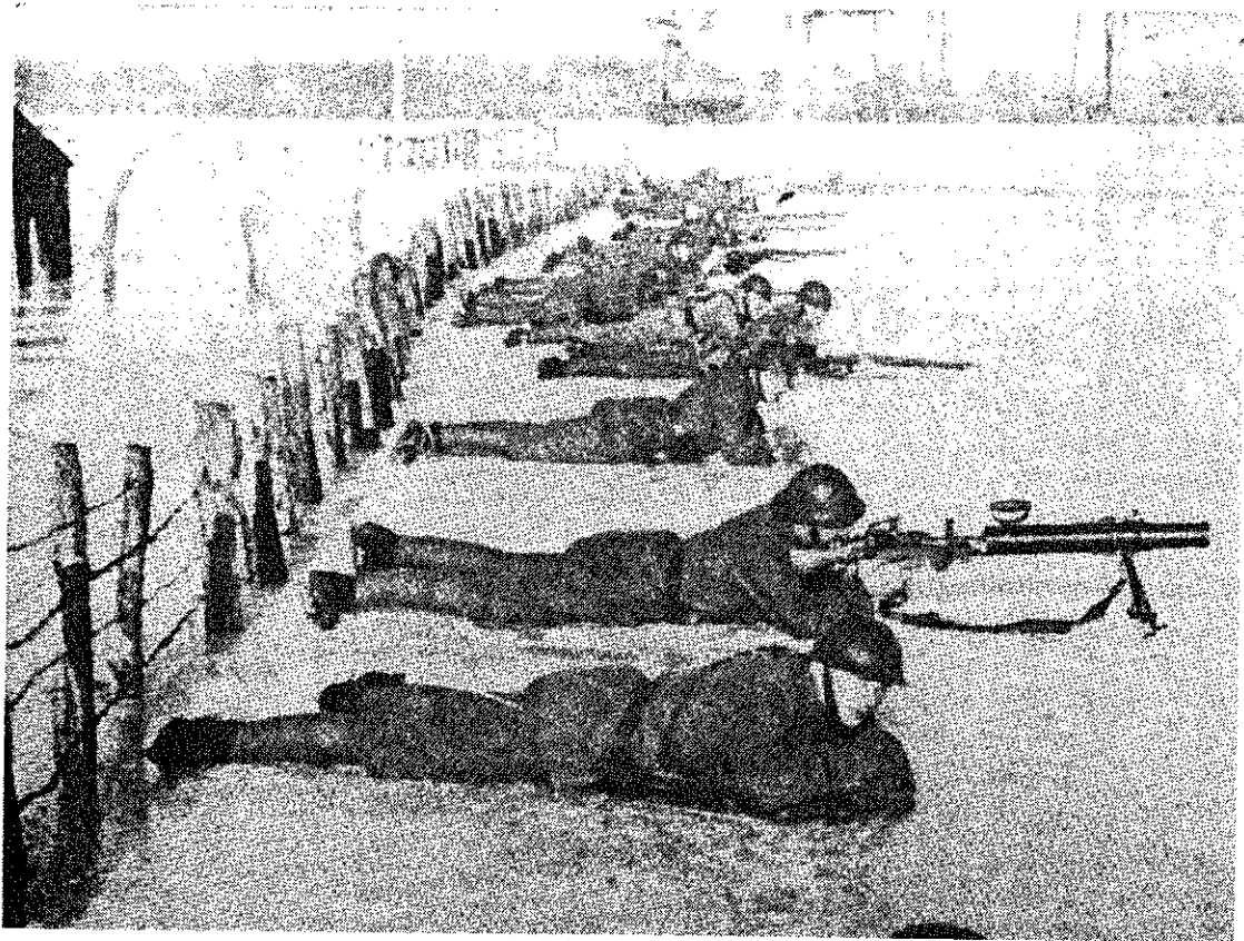
Oefenen op het ijs bij Rhenen in 1940.