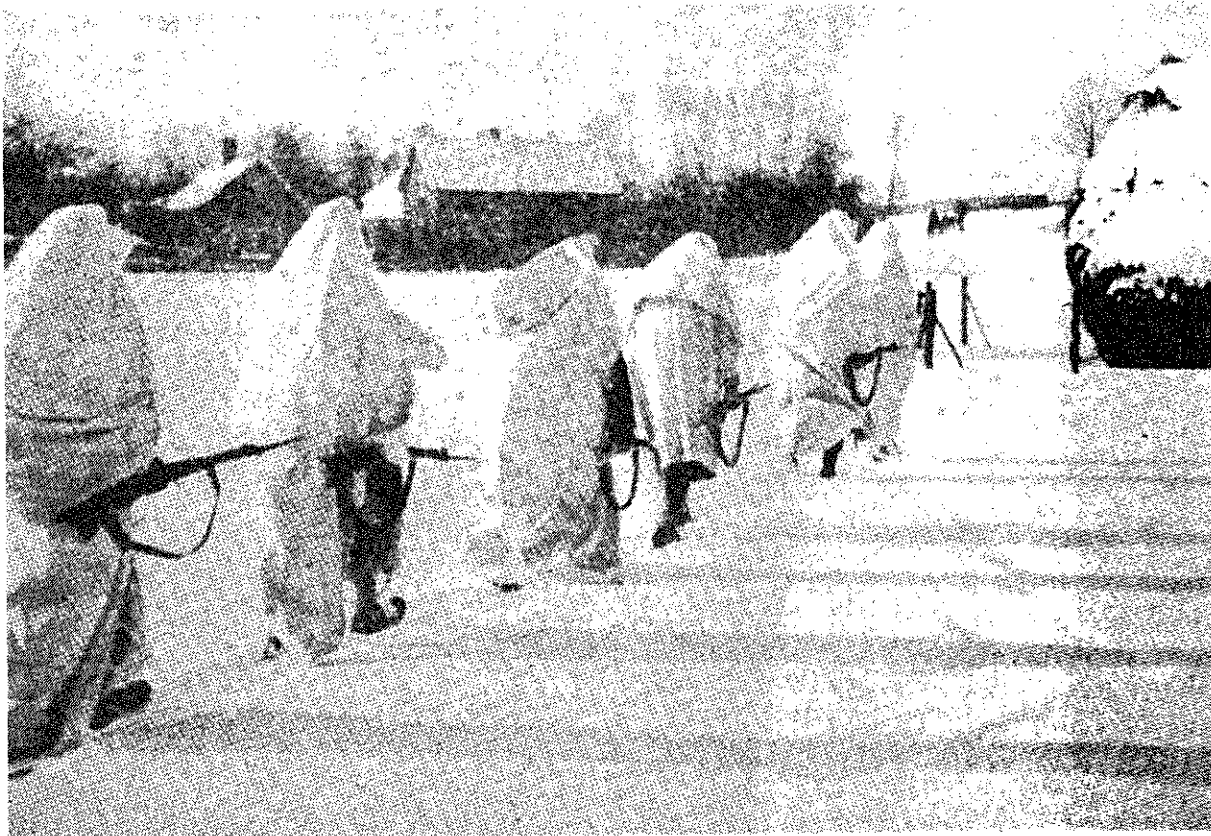
Op oefening in de sneeuw bij Rhenen in 1940.