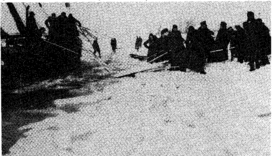
Nederlandse soldaten bezig met het openzagen van ijs op de Grift.

In Ouwehand's Dierenpark was er in die winter een ijsberen tweeling geboren, een uniek verschijnsel in die tijd.