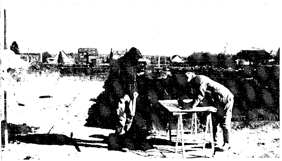
Opgravingen te Elst voorjaar 1995.