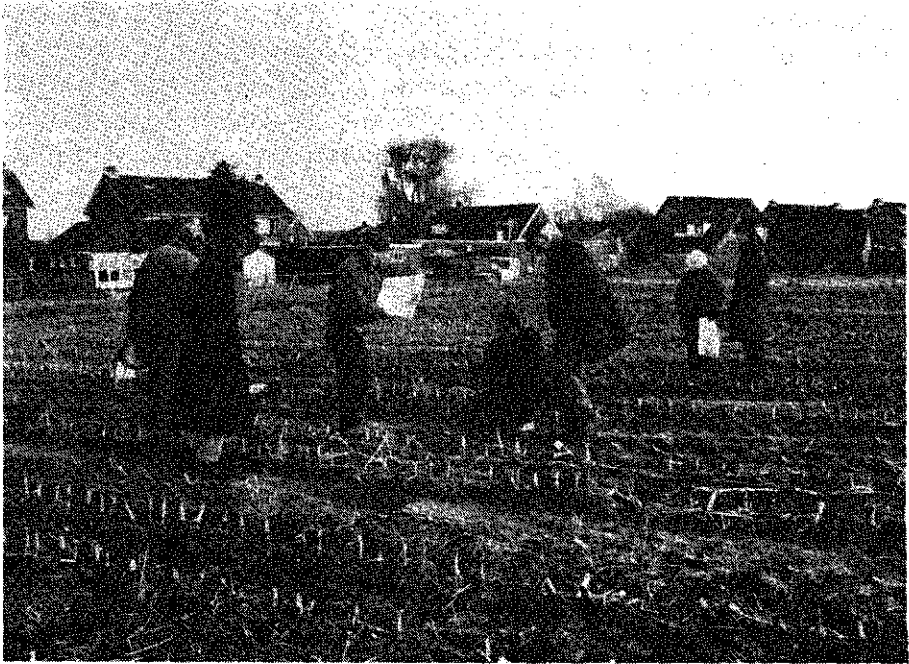
Veldverkenning in Achterberg

gulden tot twijntich gevalueerde stuijvers ijder gulden. Ende dat voor den tijt van thien eerstcoomende jaren aevanck nemende den 1 mej 1644. Ende soo voorts tot den uijtteijnde toe, gelovende mede geen lombarden meer te sullen admitteren, hem toelatende dat hij tsijnen prfijte een persoon, die hij daer toe sall willen verkiesen int Rhenense veen sall mogen stellen, mits dat den selven persoon de panden ofte pant niet en sall mogen vercopen, dan ten overstaen van die vande gerechte deser stede gelijk alhier geschiet lasten onse borgeren ende ondersaten sij hier na te reguleren. Des ten oirconde hebben wij onser stede zegell opt spatris deser doen drucken, ende bij den secretaris uijt onser aller naem doen onderteijckenen. Gegeven binnen Rhenen desen ses ende twijntichsten dach van meert inden jare XVIc ende vier ende dartich, ende was onderteijckent ende was onderteijckent Ant(honie) Both ende leger stont het cachette vande stadt.