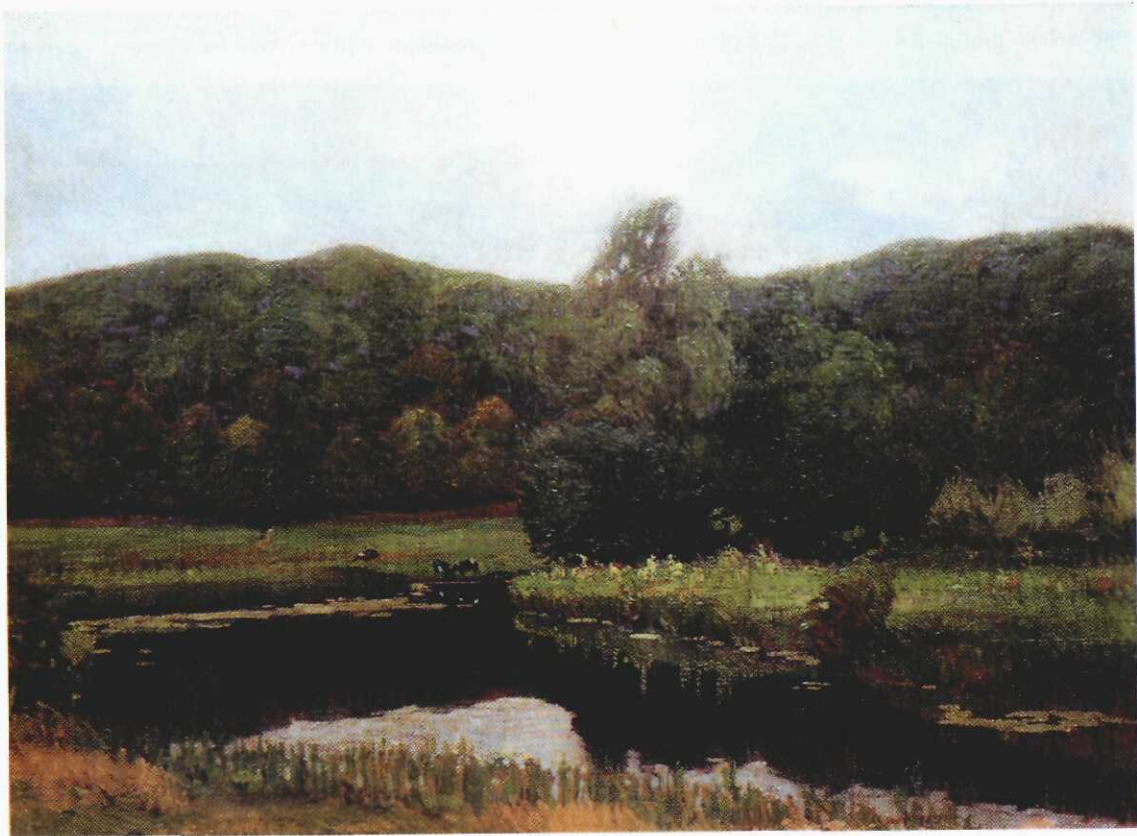
Schilderij van Wilhelm Tramp uit 1913 waarschijnlijk voorstellende gezicht op de Grebbeberg vanaf één van de meest westelijke bastions van de vestingwerken rondom de Grebbesluis. Het schilderij kon worden aangeschaft uit een gift van een verenigingslid.