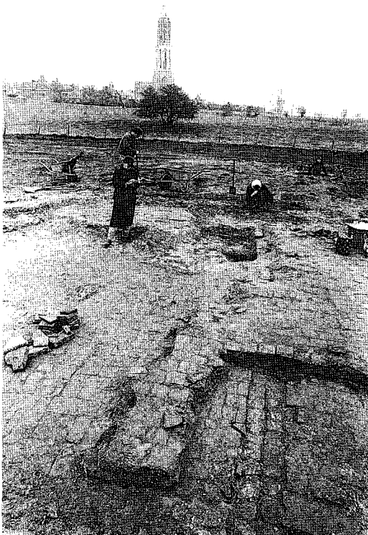
Opgravingen in 1983 en 1984 aan het oude veerhuis in de Palmerswaard.

In de vergadering van 29 juli 1983 werd op de vergadering