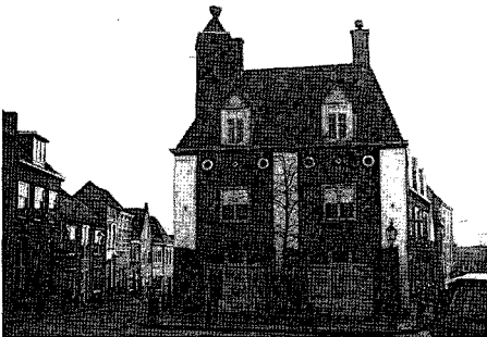
Het gemeentemuseum het Rondeel aan de Kerkstraat in december 1997

een nieuwe naam bedacht: Streekmuseum Het Rondeel. Het Rondeel is een benaming die in de volksmond reeds ver vóór de oorlog gebruikelijk was voor het pleintje vóór de punt tussen Kerkstraat en Rijnstraat. Op dit punt, dat overigens voor de oorlog iets noordelijker heeft gelegen, stond vroeger een huis dat sinds de 17de eeuw 'Schenkenschans' heette en het pleintje droeg toen de naam van Botermarkt.