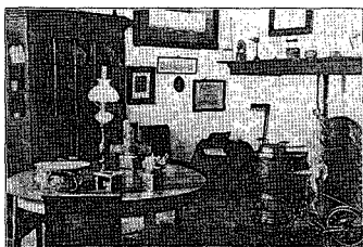
Museum „de Oudheidkamer“.

Het Museum „de Oudheidkamer“ is gelegen in het meest romantische gedeelte van Oud-Rhenen. De vervlogen eeuwen spreken hier een duidelijke taal. De oude stadswallen anno 1346 waarop de Panoramamolien gebouwd werd, gelegen in 'n bolwerk, vormen een Oud-Hollandsch tafereel zonder weerga. Direct aan dit complex grenst het Museum. Het is gevestigd in een gebouw dateerende uit den tijd van de Bataafsche Republiek en heeft gedurende den Franschen tijd dienst gedaan als hospitaal. In dit gebouw zijn thans ondergebracht praehistorische voorwerpen (ook een mammothkies). Ook uit het steenen, bronzen en ijzeren tijdperk treft men voorwerpen aan. De verzameling oude munten en oude prenten trekken bijzonder de aandacht. Het Museum is gedurende de zomermaanden dagelijks van 10 uur tot 21 uur geopend.