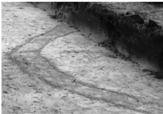
Kringreppel van een grafheuvel.

Naar gewoonte was de morgen gewijd aan korte lezingen en verslagen van verschillende werkgroepen. De middag werd verdeeld tussen het plaatselijke museum en een bezoek aan het terrein rondom de kasteelruïne van de middeleeuwse bisschoppen van Utrecht. De Wijkse werkgroep had zijn best gedaan om er een aantrekkelijk programma van te maken en naar bleek waren de leden in die opzet zonder meer geslaagd. Dank! Dank ook aan de provinciaal archeoloog en zijn medewerkers, die deze altijd drukbezochte bijeenkomst organiseerden.