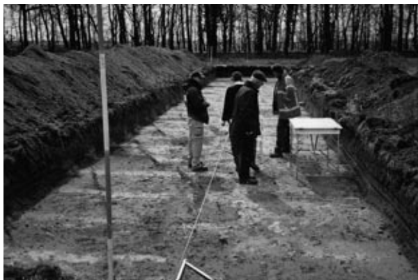
Ontginningsgreppels in 2005.

750 v.Chr. en het jaar 0), maar nadere bestudering ervan moet een nauwkeuriger datum kunnen opleveren.