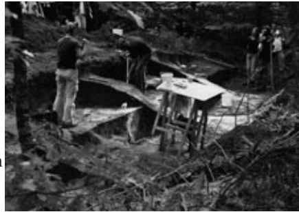
Grafhevel op landgoed Prattenburg.

Archeologen van bureau Archol onderzochten in oktober de omgeving van het toekomstige multifunctionele centrum in Elst. Zolang de bouw in 't Bosje voortgaat, staan de oudheidkundigen paraat om in dit interessante gebied boringen te verrichten of proefsleuven te graven. Leden van de WAR brachten een bezoek en maakten wat foto's van een proefsleuf met daarin een kringgreppel, die verdacht veel deed denken aan de greppels die in een bepaalde periode van de prehistorie rond een grafhevel waarschijnlijk de grens tussen de wereld der levenden en het rijk der doden aangaven. Niet ver er vandaan leken paalkuilen te wijzen op misschien een spieker, een graanpakhuis. Eens te meer een vermoeden of zelfs het bewijs dat Elst al sedert de prille prehistorie een aangenaam oord is om te wonen.