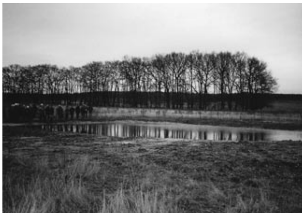
Paddenpoel op de Plantage Willem III.

paddenpoel even ten noorden van de huidige proefsleuven werd gemaakt. Net als toen werden bij het huidige onderzoek grondsporen aangetroffen die deskundigen herkenden als ontginningsgreppels ter verbetering van de bodemstructuur. Het in de directe omgeving gevonden aardewerk stamt uit de IJzertijd (grofweg tussen