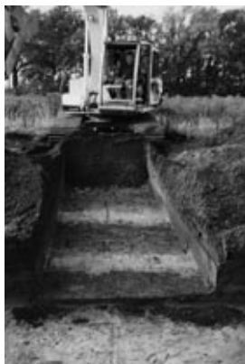
Ontginningsgreppels in 2000.