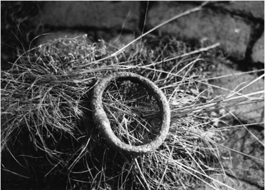
De bronzen armband uit een crematiegraf

Vereniging Oudheidkamer Rhenen e.o. in september van dit jaar werd in overleg met de provincie dit cultuurhistorische kleinood in bruikleen overgedragen aan museum Het Rondeel.