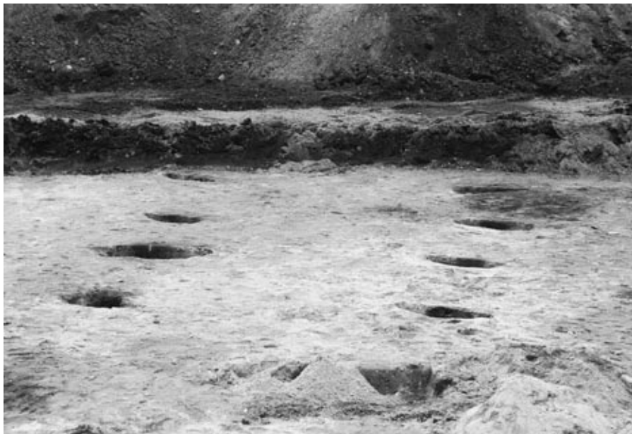
Paalsporen van een boerderij van tenminste 2.500 jaar geleden

uitgenodigd voor een archeologische begeleiding tijdens bouwwerkzaamheden op landgoed De Tangh. De verwachtingen waren hoog gespannen vanwege vondsten in de naaste omgeving, zij het van een aanzienlijk aantal jaren terug. De ontvangst was heel vriendelijk, maar de bouwput met funderings sleuven voor een schuur bracht geen enkele archeologische bijzonderheid aan het licht.