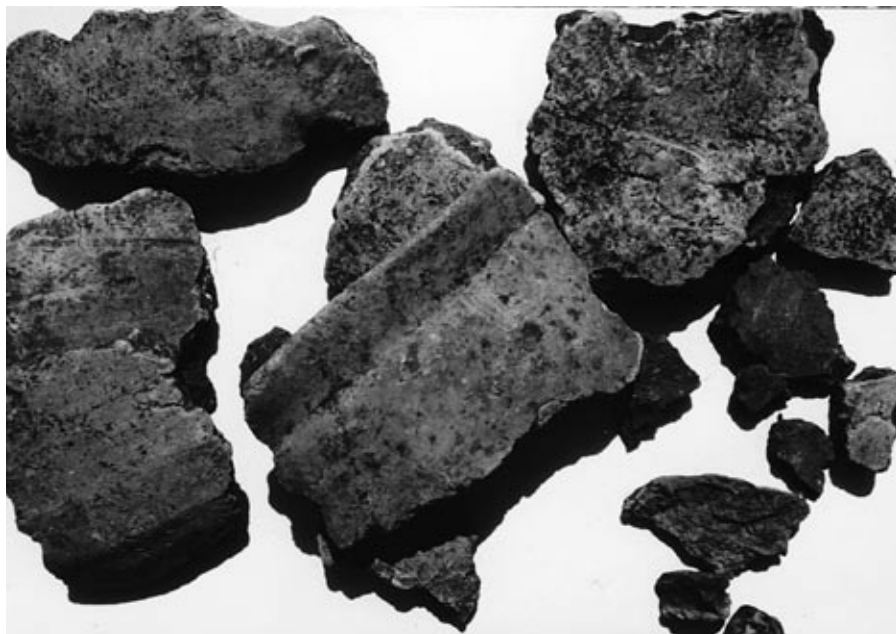
Scherven van een crematie-urn

tijd in beslag: de aanwezige amateur-archeologen konden slechts wat foto's maken, een aantal scherven van crematie-urnen en een bijzondere vondst, een bronzen armband, bergen.