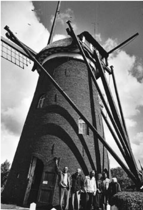
De molen van Elst (U)

werden op het maaiveld enkele fragmenten van kloostermoppen en aardewerk aangetroffen. Daarbij bleef het, jammer genoeg.