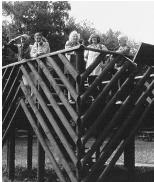
Op de uitkijktoren

Gedurende de zomer maakte de gemeente bekend dat begraafplaats 'De Larikshof' binnen afzienbare tijd aan uitbreiding toe was. De gedachte ging ernaar uit de bosstrook aan de westzijde en een deel van het bos aan de noordzijde hiervoor op te offeren. Bij de WAR kwam het verzoek binnen om aan te geven of hier ooit