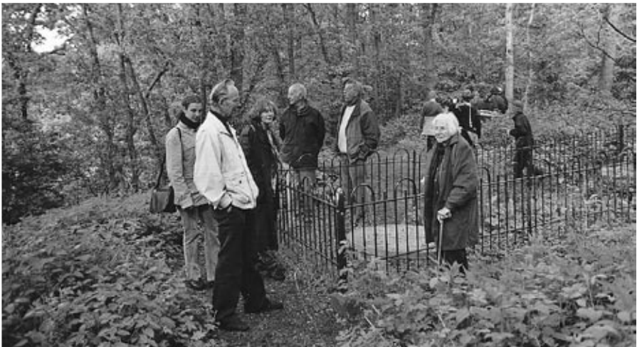
In het bos van Amerongen Werd elke deugniet opgehongen

In Amerongen bezocht de groep de plaats waar vroeger de galg stond. De ontdekking van mevrouw Delfin werd enkele tientallen jaren terug door de