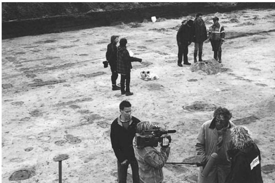
Publieke belangstelling bij grondsporen van een boerderij uit de IJzertijd.