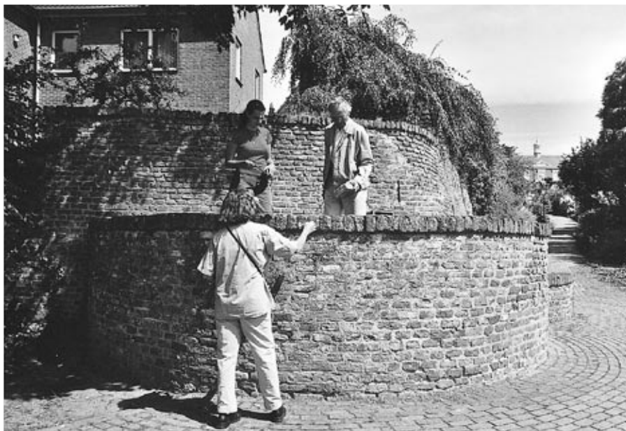
In deze eeuwenoude straat Neemt men een kloostermop de maat

gemeente Amerongen gehonoreerd met een aardig, heel duidelijk monument. In dezelfde omgeving toonde onze gids ons de restanten van kasteel Lievendaal. Op de terugweg werd de grote, zwaar beschadigde grafheuvel tegenover het pannenkoekenhuis tussen Amerongen en Elst bekeken. Weliswaar had Staatsbosbeheer de grootste gaten gedicht, maar een echte restauratie had helaas nog steeds niet plaatsgevonden.