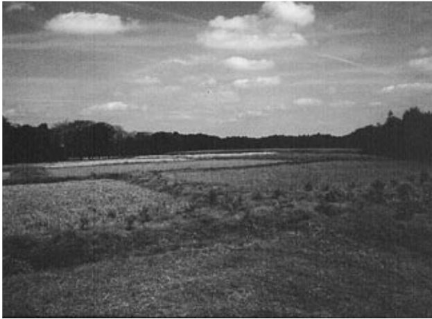
Het Celtic Field te Wekerom

sprake was geweest van archeologische vondsten. Daar enkele groepsleden wisten dat zich hier de restanten van een Celtic Field bevonden, bracht de WAR in zijn geheel een bezoek aan deze locatie. Een aantal sporen werd teruggevonden. De rest van de tijd werd gebruikt om een terreinverkenning op de kale akker ten westen van de Larikshof te houden.