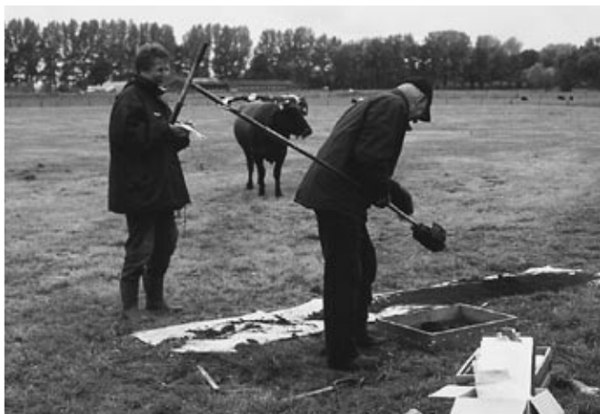
Hoe kom je aan een kasteel?

maar duidelijk zichtbare walletjes. Wie weet maken wij nog eens mee dat ook in de omgeving van Rhenen (bij de Larikshof bijvoorbeeld?) zo'n prehistorische bezienswaardigheid hersteld wordt.