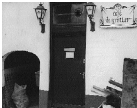
Poortje van het Horsthofje

Heel wat Rhenenaren zullen het Horsthofje niet kennen. Naast café “de Grutter” in de Grutterstraat bevindt zich een laag poortje. Hierachter bevond zich vroeger een hofje met enkele eenvoudige woningen. In “Achter Berg en Rijn”, het fotoboek van onze voorzitter, de heer Deys, staan enkele afbeeldingen van het hofje en de bewoners, terwijl de kunstschilder H.E. Roodenburg aan het begin van de vorige eeuw van dit markante Rhenense stadsgezicht etsen maakte.