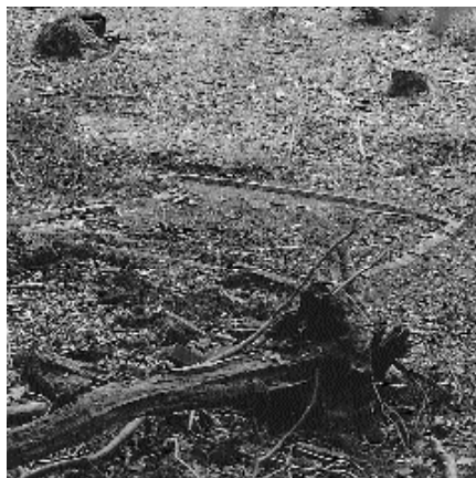
Een geheimzinnig vloertje vlak bij een grafheuvel