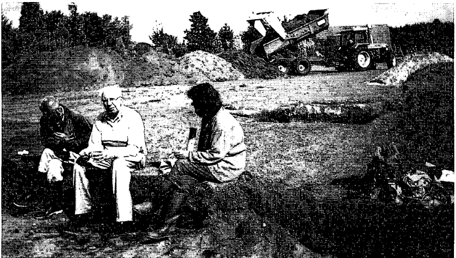
Bouwput Franseweg 124a.

De werkgroep was bijzonder in zijn nopjes met het feit dat de bouwer van het nieuwbouwhuis aan de Franseweg 124a geen bezwaar had tegen onze aanwezigheid bij het uitgraven van de bouwput.