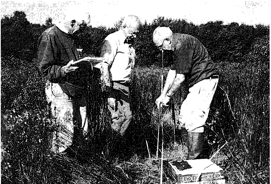
Proefboringen Paddenpoel Plantage Willem III.

De WAR vroeg en kreeg toestemming van de eigenaars en van de provinciaal archeoloog om door middel van boringen zo mogelijk vast te stellen of de plek van de toekomstige poel archeologisch interessant was. Het onderzoek leverde behalve