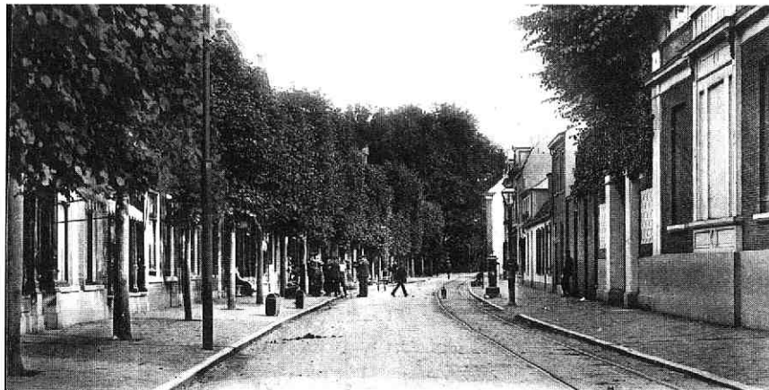
De 2e Dorpsstraat met één van de laatste openbare pompen. Foto uit circa 1900.