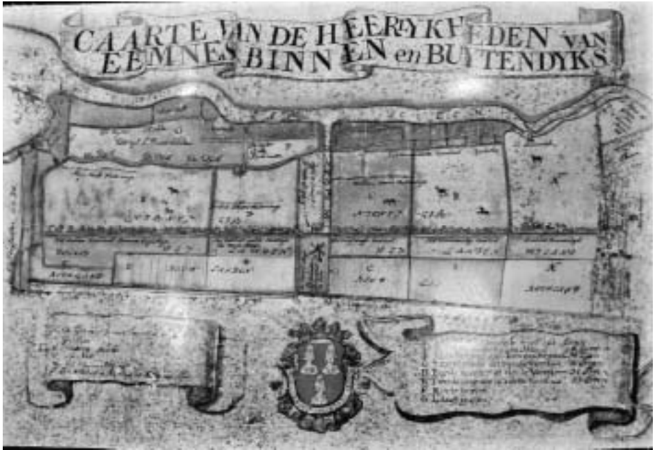
Een der eerste kaarten van de beide Eemnessen uit ca. 1710. De maker is anoniem.