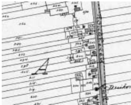
Kadasterkaart uit 1842. Op sectie 273 is naast de bebouwing ook de hooiberg ingetekend. De 'dijk' wordt hier 'Wackersweg' genoemd.