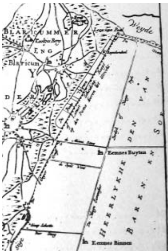
Detail van 'de nieuwe kaart van het baljuwschap Gooiland' uit 1750. We zien hier de 'Hoge Eemnesser Zeedijk of Hoge Dijk' als weg (zandpad) vermeld. Ook de Bouwvenen en het huis Ruysdael zijn ingetekend.