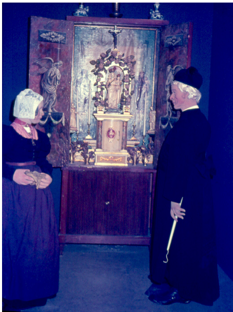
Een schuilkerkaltaar uit Laren, verborgen in een openslaande kast. De priester op de voorgrond in vol ornaat, is onwerkelijk. In zijn hand heeft hij een kaarsenaansteker. Het vrouwtje aan de andere kant is gekleed in Laarder dracht. Deze opstelling was vroeger te zien in het Goois Museum te Hilversum

We waren oorspronkelijk in de veronderstelling, dat de pastoor met zijn be-minde gelovigen gezamenlijk overge-