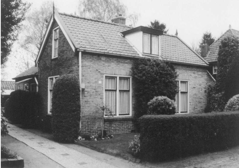
Nieuweweg 24, 16 april 1998

ca. Hij is ook wel scharenslijper geweest. En die heeft ook nog gespeeld op de bruiloft van mijn oudste zuster, toen wij in Laren woonden. En hij kwam later hier als scharenslijper. Dan dronk hij hier een kop koffie mee. Die mensen moesten weg, hè. Het kamp werd afgebroken. Ja, toen hebben ze de wielen er nog onderuit gehaald. Ze werden weggesleept, want ze wilden niet, dus hebben ze de wielen er onderuit gehaald. Een beetje saboteren, zo van dan kunnen we niet weg? Ja, maar dat was wel zielig hoor. Wij vonden het ook jammer dat de mensen weggingen, zij ook. Ik geloof dat de meesten in Hilversum terecht gekomen zijn. In de Egelshoek.