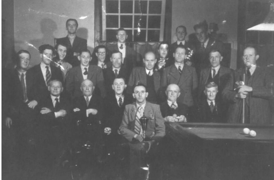
De biljartclub, daar zat mijn vader nog bij, hier in Eemland. Die foto is al meer als vijftig jaar oud. van boven naar beneden, van links naar rechts: