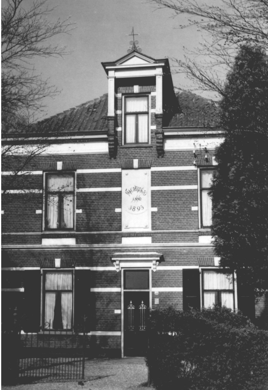
Tientallen jaren had het huis het aanzicht, zoals op deze foto van 1954. Nu laat Ton Makker restauratie en vernieuwing uitvoeren.