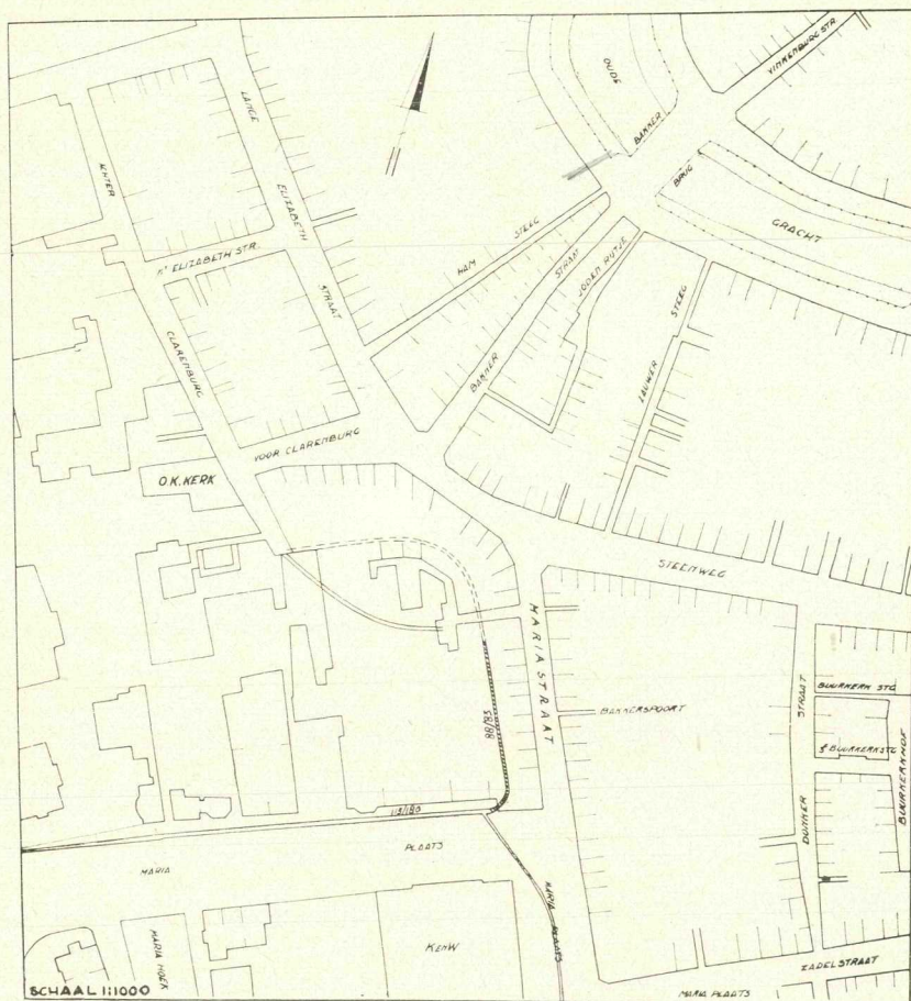
Op den hier afgedrukten plattegrond van het stadsgedeelte tusschen de Mariaplaats en de Oudegracht is aangegeven het verloop van een nog bestaand riool achter de huizen aan de Mariasstraat,

Maar hoe die dan van daar liep (of nog loopt) tot aan de achterpoort van Het Kasteel van Antwerpen? Misschien zal te eeniger tijd door andere vondsten het antwoord op die vraag gegeven kunnen worden.