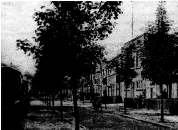
De Torenstraat waar in 1906 de Volksbibliotheek kwam.

zomer van 1904 nog een winkelkast, die door aanpassing 500 boeken kon bevatten. Daar de rijtuigfabriek wilde verbouwen moest het huis in april 1906 worden verlaten. Voor f 156,- per jaar werd in de Torenstraat n° 4 ruimte gevonden. Na zes jaar daar te hebben gezeten werd in het najaar van 1912 verhuisd naar de Tuinstraatschool (later Theo Thijssenschool), nu Stichting Welzijn Ouderen aan de Jasmijnstraat. Van de gemeente had men vergunning gekregen om de bibliotheek in de gymnastiekzaal onder te brengen en ook de uitlening daar te verzorgen. Van alle losse kasten werd een geheel gemaakt met uittilbare deuren. Uit praktische overwegingen werd de kast in 1937 van harmonicadeuren voorzien en dat bleek een hele verbetering te zijn.