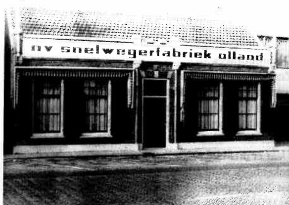
Het pand van Olland waar voorheen de rijtuigfabriek van de fa. Ingenhoes/Buitenweg was gevestigd.

jaren is daar Reclame Bureau/Zeeafdrukkerij Witteman gevestigd. De kamerhuur in die tijd bedroeg f 40,- per jaar. In de maanden oktober t/m april (later t/m maart) werden op donderdag de uitleningen gehouden. Of de huisvesting bij Van Santen niet beviel vermeldt de historie niet, maar met ingang van 1 mei 1901 huurde men voor f 100,- per jaar een ruimte van de Biltsche Rijtuigfabriek van de fa. Ingenhoes/Buitenweg aan de Dorpsstraat. In 1926 heeft de fa. Olland dit pand gekocht.