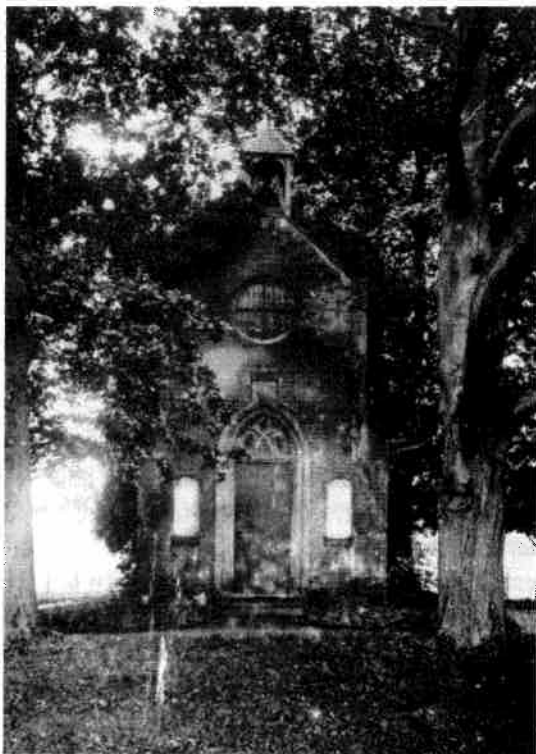
De folly zoals deze er in de jaren zestig uitzag

De folly verkeerde al jaren in ruïneuze staat. Er moest iets gebeuren, maar wat. De eigenaar, de Stichting Het Utrechts Landschap, en de architect, de heer ir. C.M. Beenen, hebben verschillende mogelijkheden in overweging genomen. Zo is de mogelijkheid besproken om de ruïne verder te laten vervallen tot er niets meer van over zou zijn. Deze optie is verworpen omdat het gebouwtje hiervoor te bijzonder is. Een tweede mogelijkheid was om de huidige staat van het gebouw te consolideren zodat verder verval voorkomen kon worden. Consolideren dus van de huidige ruïneuze kapel door deze wind- en waterdicht te maken of door bijvoorbeeld een tentconstructie over de ruïne te maken. Deze laatste mogelijkheid werd als te storend ervaren. Een derde mogelijkheid is om de folly te slopen en opnieuw weer op te bouwen. Deze optie werd als te kostbaar van de hand gewezen. Een laatste mogelijkheid is om de folly te restaureren. De vraag is echter hoe. Welke bouwfase neem je daarbij als uitgangspunt.