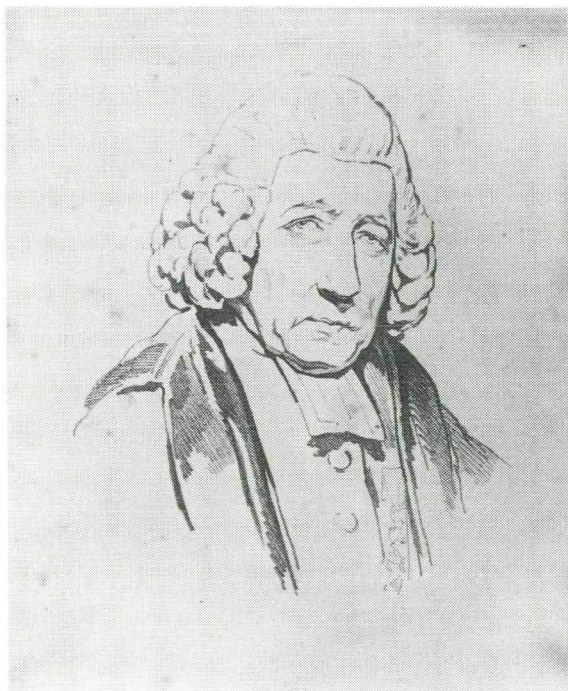
Portret van J.W. te Water Anonieme litho, begin 19de eeuw 's-Gravenhage, Iconografisch Bureau