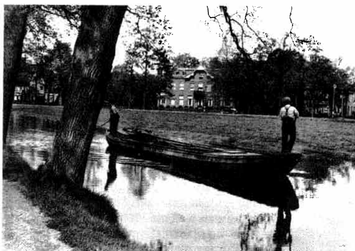
Gezicht vanaf de Emmalaan met de Biltse Grift, een stukje van weiland De Geer en op de achtergrond het huis Zorgvliet . Illustratie uit Utrecht in Woord en Beeld 29 mei 1931 (verzameling Historische Kring d'Oude School).