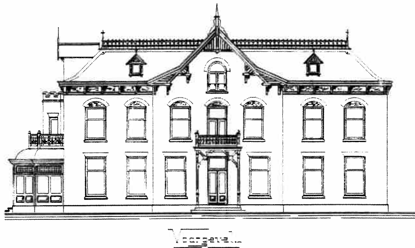
Bouwtekening uit 1900 van de voorgevel van het nieuwe huis Zorgvliet.