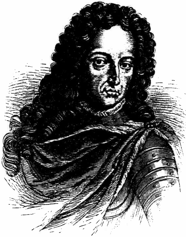
Prins Willem III, door de Staten-Generaal tot kapitein-admiraal-generaal van het Staatse leger benoemd.