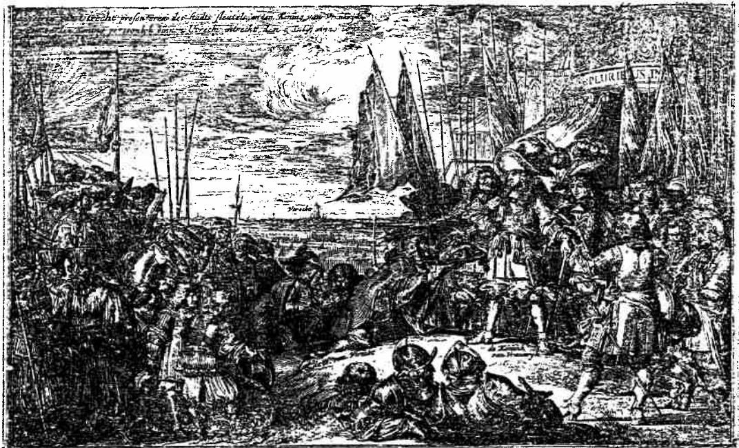
De magistraat van Utrecht biedt Lodewijk XIV de sleutels van de stad aan.