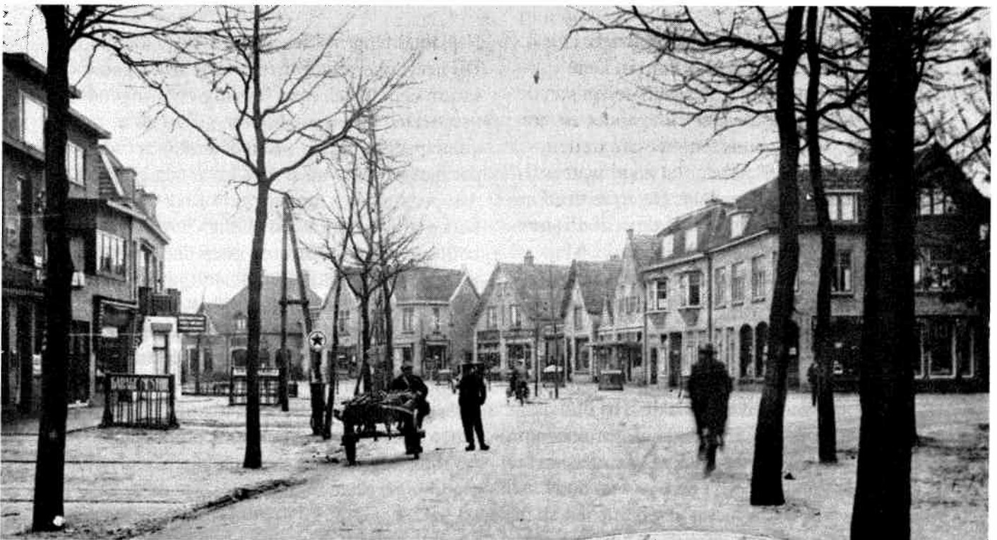
Julianalaan hoek Vinkenlaan in Bilthoven gezien richting Den Dolder.

U geniet, hoop ik, allen van een eigen erfje in ons uitverkoren Bilthoven. Ik heb u vanavond verteld waarvan die perceeltjes afkomstig zijn. Ik vind dat we dit horen te weten, want: wie het grote niet eert, is het kleine niet weerd.