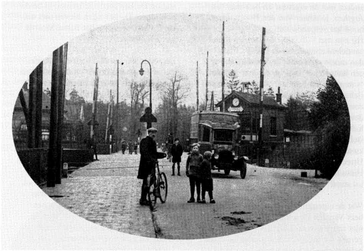
Spoorwegovergang Soestdijkseweg in Bilthoven gezien vanaf het Emmaplein in noordelijke richting. Links is het station. Rechts staat het seinwachtershuis, dat afgebroken is.