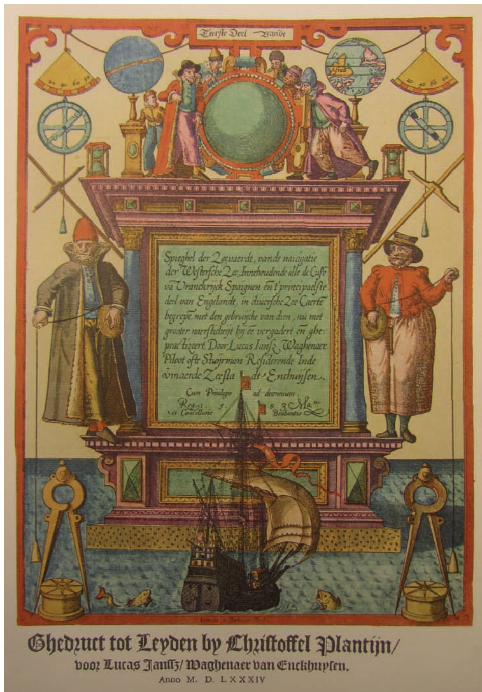
Afb. 2 De Spiegel der zeevaert van Lucas Jansz Waghenaeer (1584).