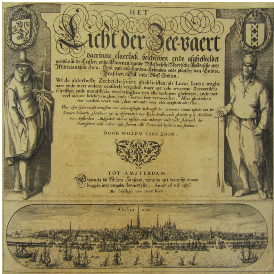
Afb. 1 Titelpagina van Het licht der zee-vaert (1608). Maritiem Museum Rotterdam WAE 119b.

demonstreren de zeemansgidsen de verschillen in bedrijfsvoering tussen Willem Jansz en Joan Blaeu.