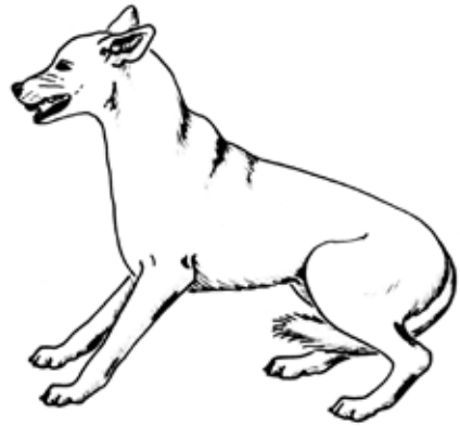
Afbeelding 2. Defensieve agressie is gebaseerd op angst en herkenbaar aan de lang teruggetrokken mondhoeken, teruggedraaide oren en ingeklemde staart.

Adequate context: bedreiging door dominante Inadequante context: vriendelijke benadering door soortgenoot/mens