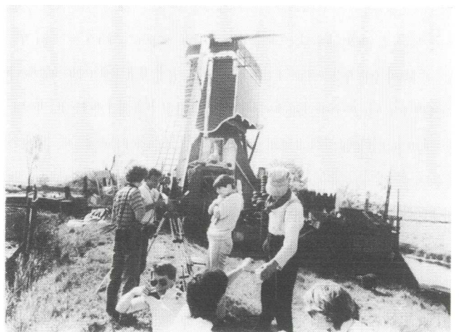
Afb. 8. Opnamen bij de Spengense molen voor de film "De illusionist".