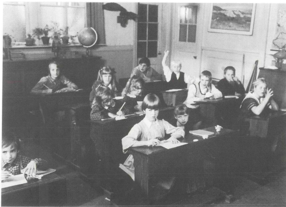
Afb. 5. Kockengense kinderen in een ouderwets schoollokaal in Ameide, in de film "Laat de dokter maar schuiven".

bus niet op kwam dagen. Het arriveren van een tweede bus kostte wat tijd, maar men heeft in Amsterdam netjes even op de buslading Kockenezen gewacht.