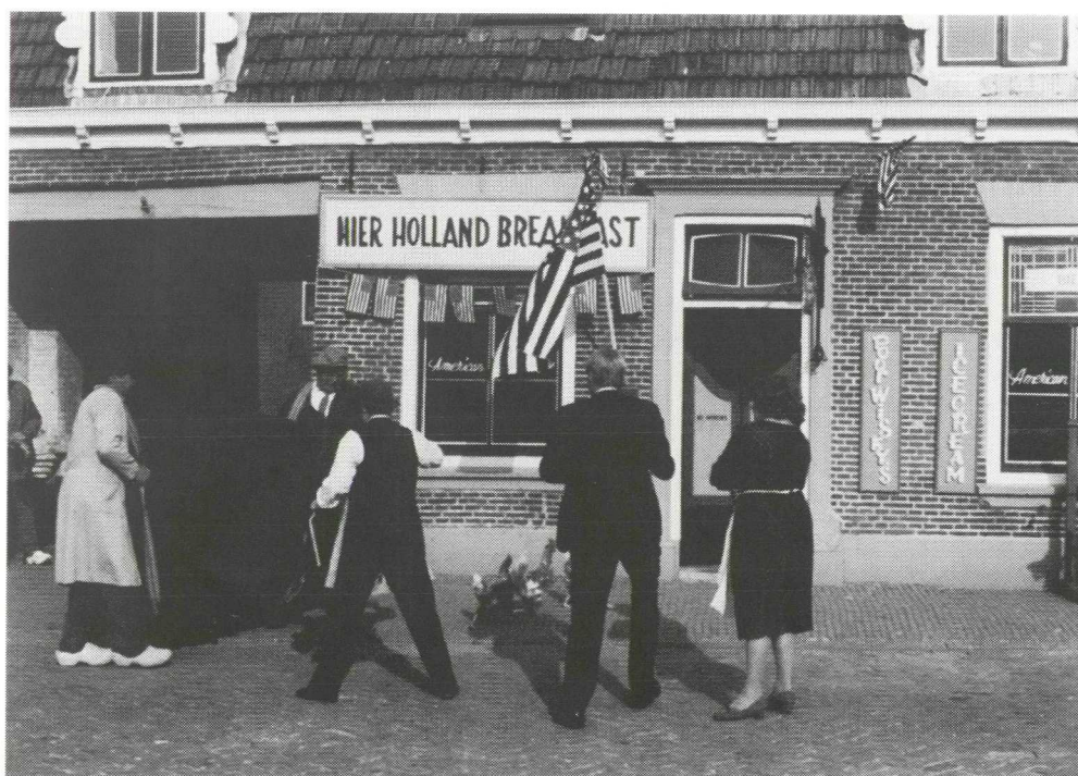
Afb. 2. Bakkerij De Rooster is veramerikaanst in "Laat de dokter maar schuiven" en heeft tijdelijk het uiterlijk van een café gekregen.