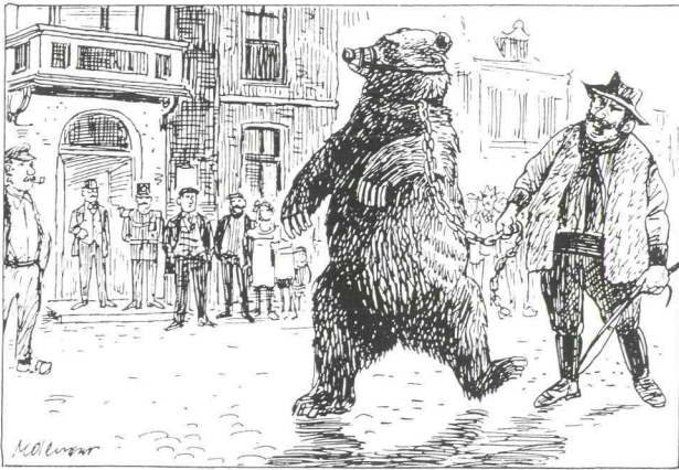
Afb. 3. Berengeleider bezoekt Breukelen tijdens de jaarlijkse kermis, in het begin van de 20ste eeuw. Op de achtergrond het Breukelse gemeentehuis aan de Nieuwstraat. (Uit: M.J. Mobach, De Jongensjaren van Arjen en Jurre. )

verden te weinig op om van te leven. In deze perioden waren de armen veelal afhankelijk van de armenzorg. De plaatselijke geestelijken bemiddelden soms bij het zoeken naar werk of gaven hen klusjes in de kerk, zoals het klaarzetten van de stoelen en stoven of het bijstaan van de doodgraver. Wie zich echter door een 'onfatsoenlijke' levenswandel onderscheidde - zijn geld verbraste aan de drank, of via kaartleggen of prostitutie bijverdiensten genoot - werd van deze hulp uitgesloten.