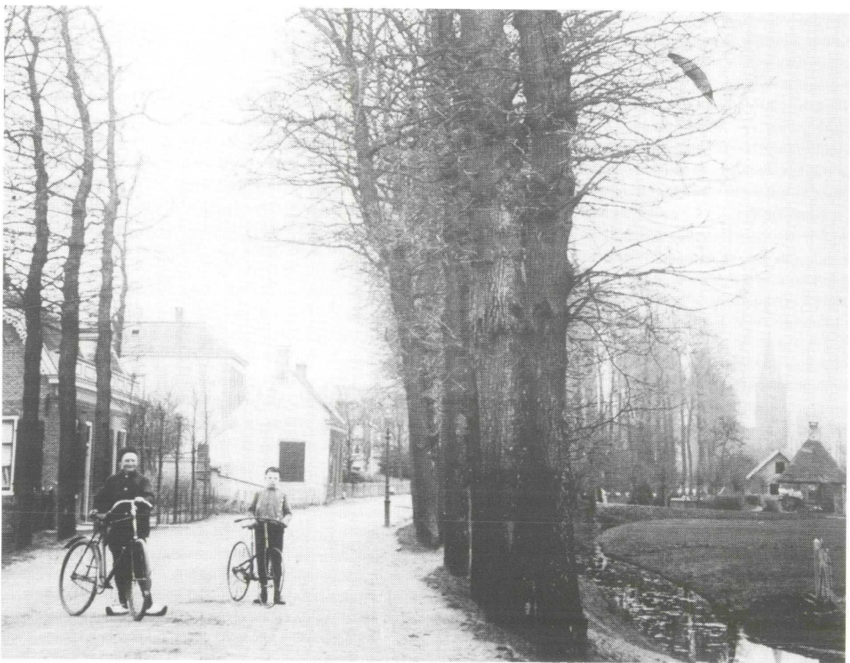
Afb. 1. Gezicht op Breukelen vanuit het noorden, met de Rijksstraatweg, het huis Spoor- en Vechtzicht met daarachter Dorpszicht en het in 1904 verdwenen toluhuis, omstreeks 1900.

In het bedrijfsleven drongen de vernieuwingen eveneens door. Rond 1870 werd de oude graanmolen aan de Vecht vervangen door een moderne stoommeelfabriek. 4 Een 'locomobiel', een ver-