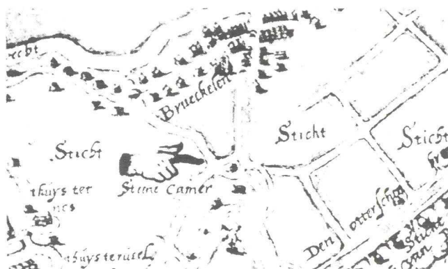
Afb. 1. Gedeelte van een kaart van Joost Jansz Beeldsnijder, tweede helft 16de eeuw, met bij de hand met uitgestoken vinger rechts de stenen kamer Galgweert (uit: Album over kerk, dorp en omgeving van Ter Aa, 1956, blz. 14).

Over de standplaats van de stenen kamer Galgweert kan al met al weinig onduidelijkheid meer bestaan.