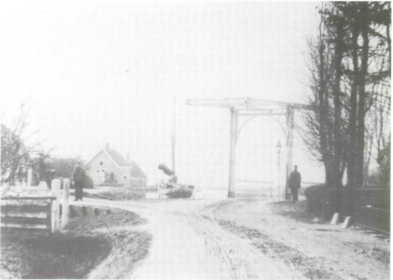
Afb. 3. De Galgerwaardse brug tussen de Poeldijk en Oud Aa, kort na 1900. Links de Nieuwe Dijk, rechts een stukje van de tuin van boerderij Galgerwaard. (Oude prentbriefkaart.)

berg Galgerwaard vier kinderen, waarvan er drie jong stierven. Twee zontjes en een dochtertje werden respectievelijk achttien maanden, een half jaar en negen maanden oud. Alleen hun vierde kind, de op 4 augustus 1876 geboren Gerarda Hendrika bereikte de volwassen leeftijd. Gerrit Arie Degenkamp liet de boerderij verbeteren, want de belastbare opbrengst der gebouwen op Sectie C nr. 1151 steeg van f 105 naar f 250 per jaar. Gerrit Arie verwierf in het dienstjaar 1874 enkele landerijen in de Breukelerwaard (Sectie B nrs. 96, 101 - 103, 129, 130 en 513). In het dienstjaar 1881 verenigde hij die percelen op Sectie B nrs. 823 (weiland 3b 15r 19e) en 833, waarop hij in 1879 aan de Straatweg een boerderij liet bouwen, die het adres Wijk B nr. 229 kreeg. Misschien hebben de droeve gezinsomstandigheden op Galgerwaard de ouders ertoe gebracht de nieuwe boerderij aan de Straatweg tegenover Vegtvljet te laten bouwen. Hun dochtertje legde daarvoor in 1879 de eerste steen. De boerderij