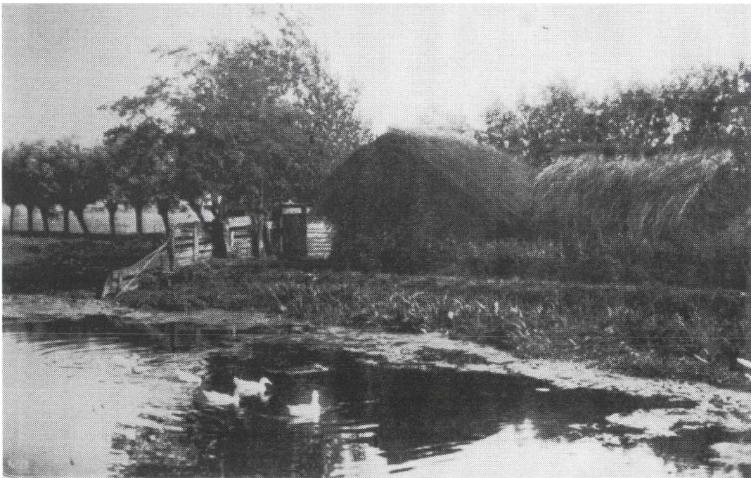
Afb. 5. Een opslag van rijshout aan de oever van de Kromme Angstel ten noorden van Nieuwer Ter Aa. Foto uit vermoedelijk de jaren 1930.