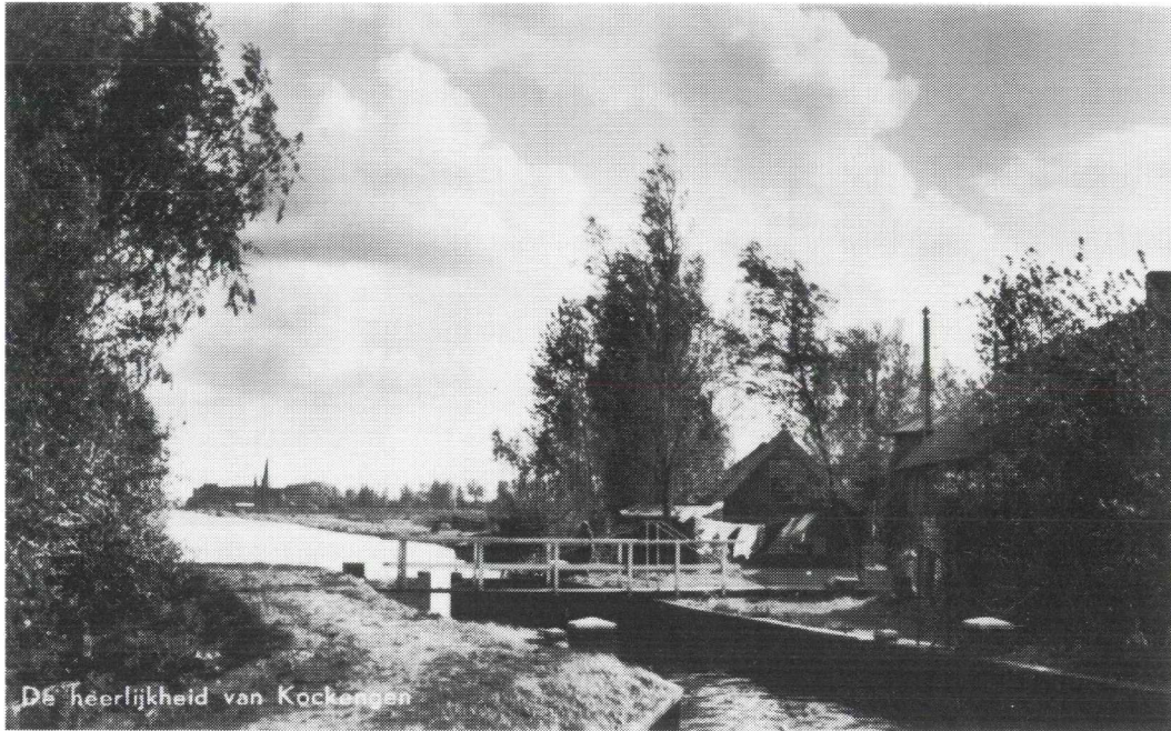
Afb. 8. De Joostendam, in het zuidoosten van de polder Spengen, waar de waterwegen Heycop en Bijleveld heel dicht bij elkaar komen. Toch mochten ze vele eeuwen lang niet met elkaar in verbinding worden gebracht, want het Sticht Utrecht wenste onder geen beding dat Hollands lozingswater de grote problemen met het waterbeheer in noordwest Utrecht nog zou verergeren. Schepen die toch wilden oversteken, werden bij de Joostendam via een overtoom, bestaande uit twee hellingen, met een windas over de kade getrokken.