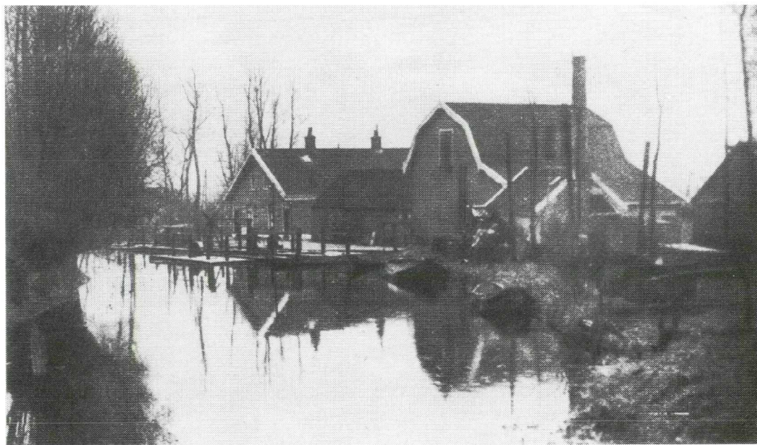
Afb. 3. Het ijspakhuis in het zuiden van Oud Aa toen het nog in vol bedrijf was. In de rivier de Aa liggen viskaren en vissersbootjes. Zie verder jaargang 11 (1996), nr. 1, blz. 35 - 38.