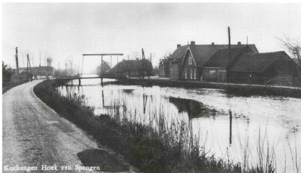
Afb. 7. Prentbriefkaart van de Hoek van Spengen, helemaal in het noordwesten van de huidige Gemeente Breukelen (vroeger Kockengen), met de ophaalbrug over de Geer. Lange tijd voer hier een pont over de tot Wilnis behorende waterloop. Die pont werd omstreeks 1900 vervangen door een tolbrug. In 1915 vond het Grootwaterschap dat de brug de scheepvaart te veel hinder bezorgde. Men beval dat de brug afgebroken moest worden en de pont weer in de vaart gebracht. Veel mensen protesteerden en meer dan dat: ze bleken bereid mee te betalen in de bouw van een nieuwe brug. De Gemeente Kockengen toonde zich bereid de bedieningskosten van een nieuwe brug geheel voor haar rekening te nemen. Al in 1917 kon men via een nieuwe ophaalbrug de Geer oversteken. Bij de aanleg van de Ir Enschedeweg dacht de Gemeente Wilnis er over de brug op te heffen, maar de bevolking wist dat te voorkomen. In 1965 en 1992 is de brug ingrijpend gerestaureerd.