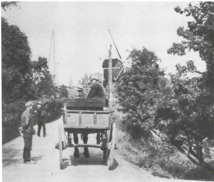
Afb. 2. "Een aardig landwegje achter Breukelen, het rustige dorp aan de Vecht" schreef een geïllustreerd weekblad ver voor de Tweede Wereldoorlog bij dit plaatje van de Stationsweg, met links het hek van de uitspanning van Van Wees en op de achtergrond de Kortrijkse molen. Tussen deze beide in ligt nu de rijksweg A2 met het viaduct "het muizengaatje".