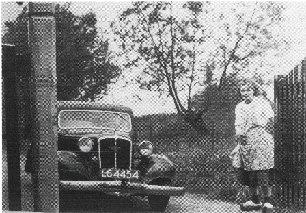
Afb. 9. De tol aan het begin van het zogeheten Pad van Bosch, dat van Kockengen naar Teckop liep. Op de linker hekpaal de tarieven: auto 25 cent, motor 10 cent, rijwiel 5 cent. Foto uit vermoedelijk eind jaren 1930.