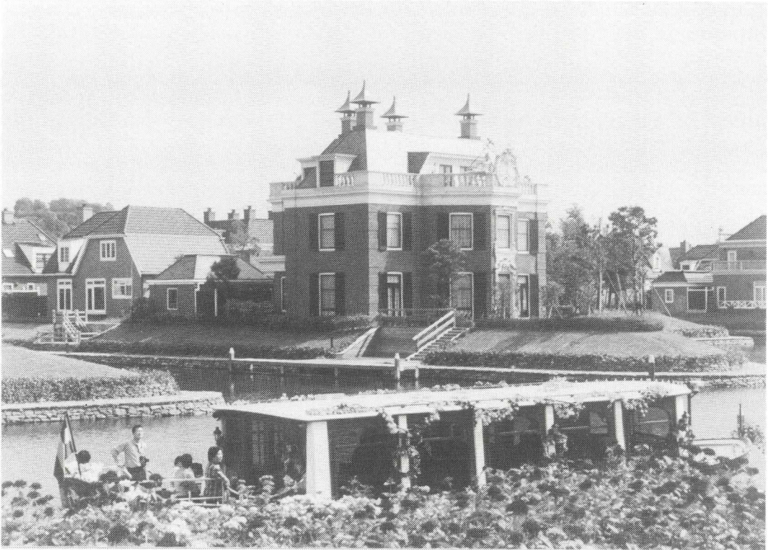
Afb. 5. Het Japanse Rupelmonde, niet aan een rivier maar aan een kanaal gelegen.