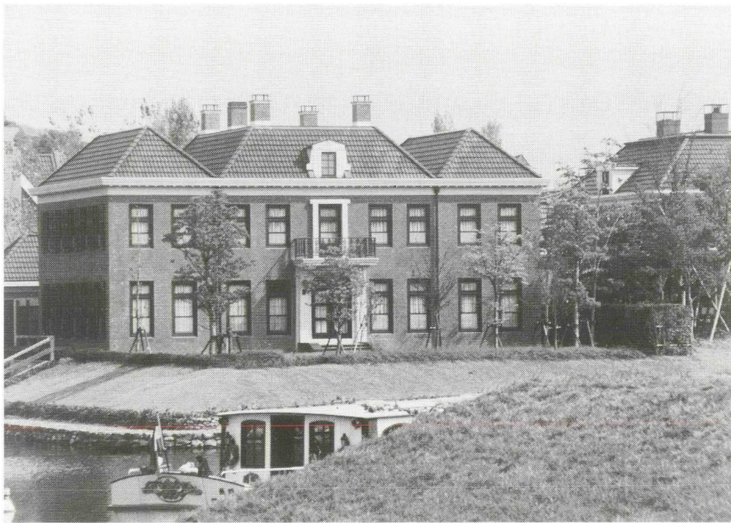
Afb. 2. Het huis Boom en Bosch in het Japanse Huis ten Bosch , ten noorden van Nagasaki.