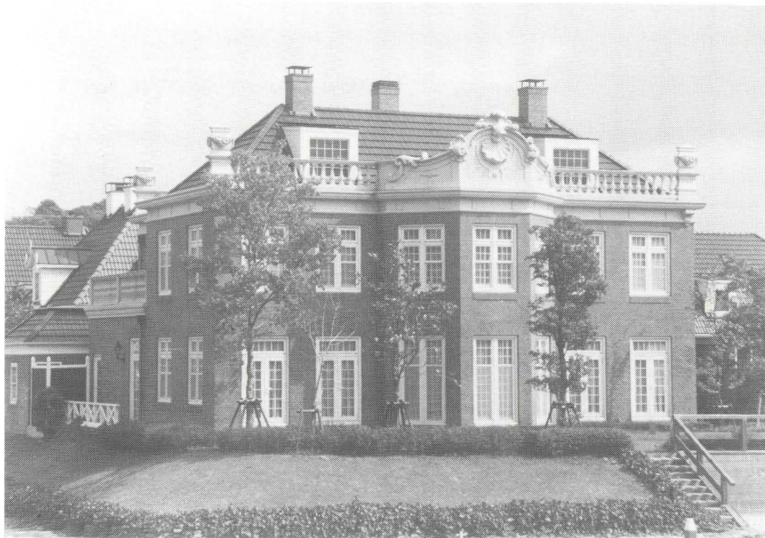
Afb. 3. De Japanse versie van Vegtvljet.