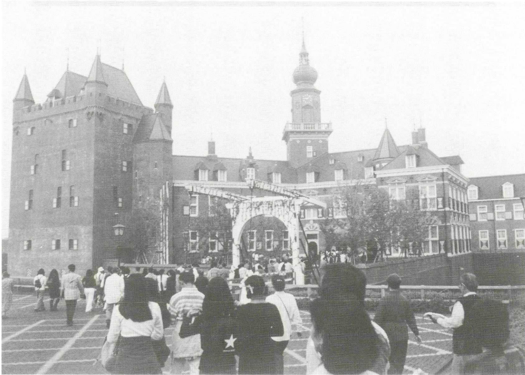
Afb. 1. De entree van Huis ten Bosch in Japan, met een kopie van het kasteel Nijenrode.