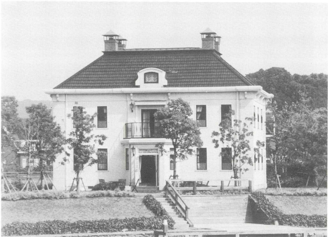
Afb. 6. Zo werd Nieuwerhoek door de Japanners nagebouwd.