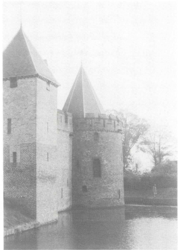
Afb. 3 (links). De zuidelijke hoektoren van slot Medemblik, vanuit het zuidwesten gezien.