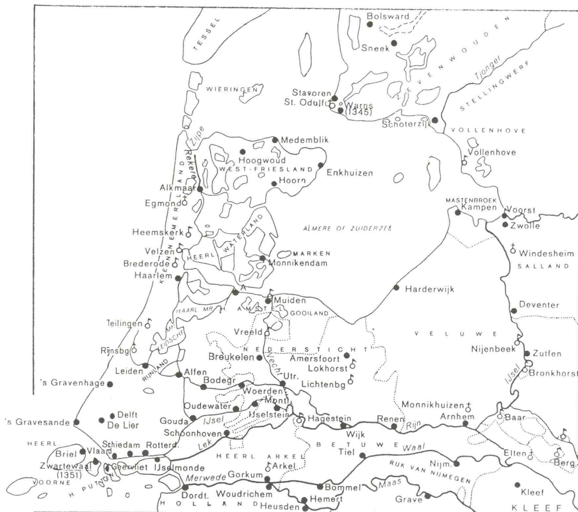
Afb. 4. Kaartje van Holland en Utrecht omstreeks het midden van de 14de eeuw, met onder meer de belangrijkste in dit artikel genoemde plaatsen.