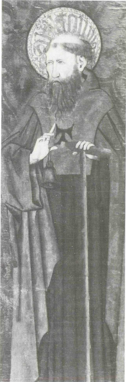
Afb. 3. Antonius Abt op het rechterluik van het Villalobos-altaar-triptiek uit circa 1460 (particuliere collectie, Bussum). Volgens Athanasius' Vita droeg Antonius in de woestijn een boetekleed, van binnen ruig van de haren, en een schapenvacht. Daarin wordt hij sinds circa 1200 bijna nooit afgebeeld. Onder invloed van de Antonianen werd het boetekleed vervangen door het habijt van hun orde; een zwart kleed met een blauwe Tau (de Griekse letter T) op de mantel. Antonius' linkerhand steunt op de zogeheten Tau-staf, waaraan dat teken is ontleend; de rechterhand heeft hij in een zegenend gebaar geheven.

habijt met het Tau-kruis, het bovenstuk van de bekende staf van Antonius Abt (zie ook Afbeelding 3). Kort na 1300 hadden de Antonianen al vestigingen in Italië, Spanje, Duitsland en het Heilige Land. In de verdere loop van de 14de eeuw kende deze orde zijn grootste verspreiding, met maar liefst 369 huizen, vrijwel allemaal gevestigd in steden en vaak (maar niet altijd) verbonden aan een hospitaal, hoewel het Sint-Antoniusvuur toen nauwelijks meer voorkwam. In de Late Middeleeuwen waren pestepidemieën de grote schrik. Van deze ziekte - die vromen en bozen, armen en rijken zonder aanzien des persoons trof - werd wel gezegd dat ze met Gods toestemming door duivels en tovenaars werd gebruikt om de vromen te toetsen en de goddelozen te straffen. Dat doet denken aan het motief achter de verzoeking van Antonius Abt.