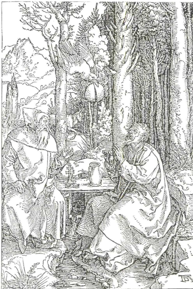
Afb. 1. Het bezoek van Antonius aan Paulus. Houtsnede van Albrecht Dürer, circa 1502 (Collectie Rijksmuseum, Amsterdam). Links zit Antonius, gekleed in een monnikspij en met op het tafeltje naast hem een bel. Tegenover hem zit Paulus, in een eenvoudig gewaad, met een staf tussen zijn armen en met enigszins verwaaide haren. Vanuit de lucht komt de raaf aanvliegen. De vogel is redelijk op schaal afgebeeld, maar komt naar beneden gesuisd als een projectiel dat zich met zijn neus in de grond wil boren; daarbij is het een raadsel hoe het diertje het tamelijk forse brood in zijn snavel geklemd weet te houden. Nog merkwaardiger is het brood zelf: de hemelse gift is in de lucht al bijna doormidden gesneden. Alsof God in de optiek van Dürer het meningsverschil van de twee heilige mannen heeft zien aankomen en dat in Zijn voorzienigheid alvast heeft willen beslechten.

De wonderen waarmee Antonius in de omgeving van Paulus geconfronteerd werd, mogen futiel lijken, ze zijn tekenend voor de manier waarop tegen Antonius' leven werd aangekeken. 7 Natuurlijk maakten christelijke heiligen wel vaker wonderen mee - ze zijn er vaak juist heilig door geworden - maar in de meeste gevallen hadden die wonderen een duidelijke functie, bijvoorbeeld doordat een heidense medebetrokkene er prompt door tot bekering kwam. In de levensweg van de Egyptenaar Antonius speelden zulke praktische motieven echter nauwelijks een rol. De verhalen over zijn leven en werk zijn meestal van zo'n functieloze sprookjesachtigheid dat Tolkien er ja-loers op geweest zou kunnen zijn.