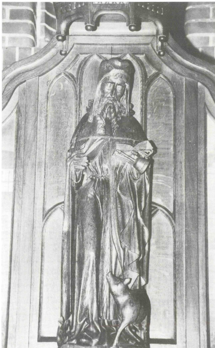
Afb. 2. Beeld van Antonius Abt, omstreeks 1500 uit eikenhout gesneden, en te zien in de Rooms-Katholieke kerk van Chaam. De staf is verloren geraakt, evenals een van de vingers van de rechterhand. Het varken, het boek en de bel zijn duidelijk als attributen van Antonius aanwezig.