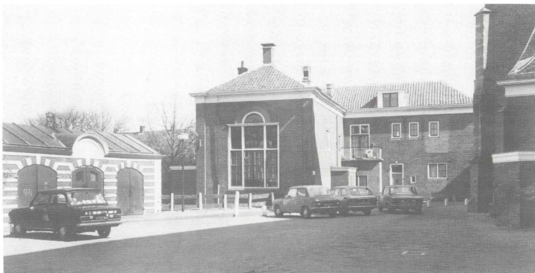
Afb. 1. Het gebouw Salvatori waarin tot omstreeks 1930 de openbare lagere school was gevestigd. Op deze plaats stond daarvoor eeuwenlang de dorpschool, waarvan het hoofd tevens de kerkelijke functie van koster en voorzanger vervulde.